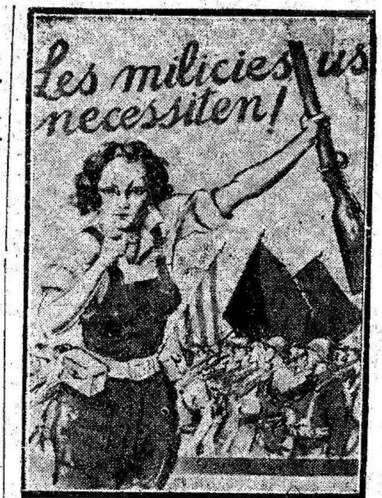
BARCELONA.—Un cartel expuesto en las calles de la población, invitando al pueblo a alistarse en las Milicias Populares

Los fascistas cometen los crímenes más repugnantes. Diariamente se fusila a numerosos prisioneros. El periódico "Ideal" publica las listas interminables de los ajusticiados.