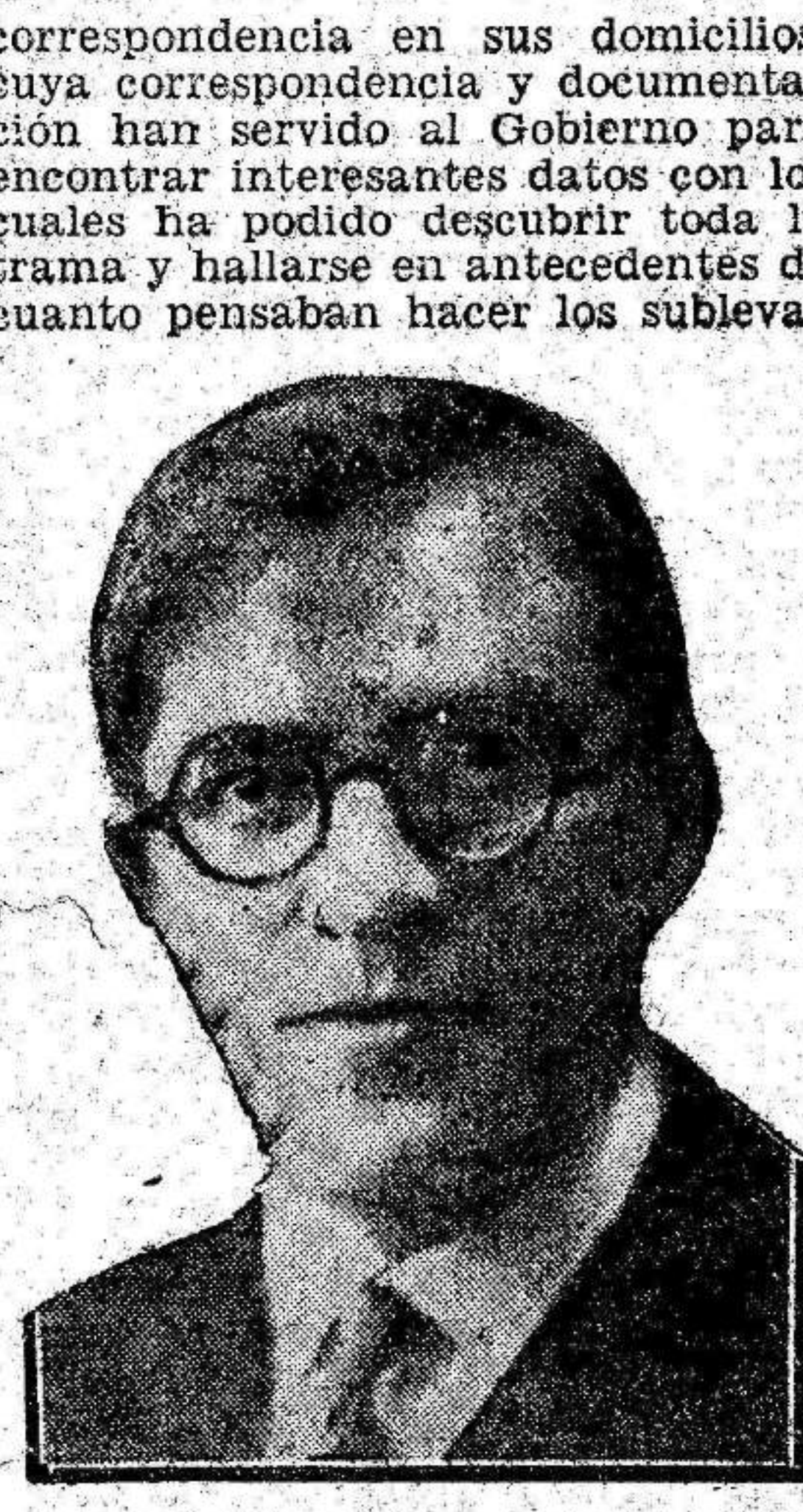
Don Julio Alvarez del Vayo