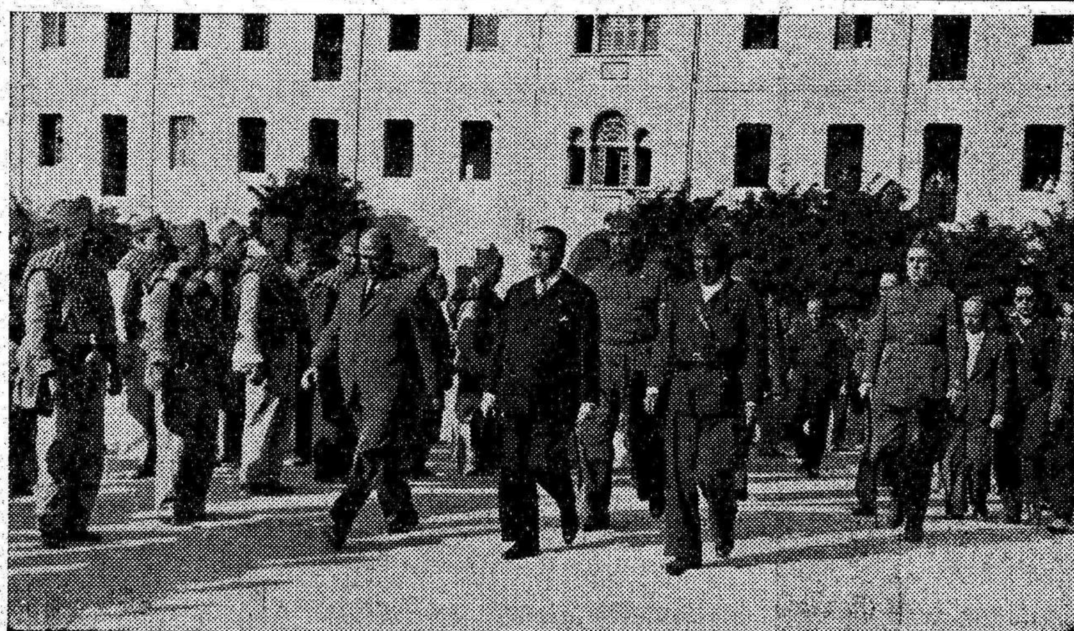
Don Diego Martínez Barrio revisando a las tropas del Ejército Voluntario, que ayer marcharon para el frente