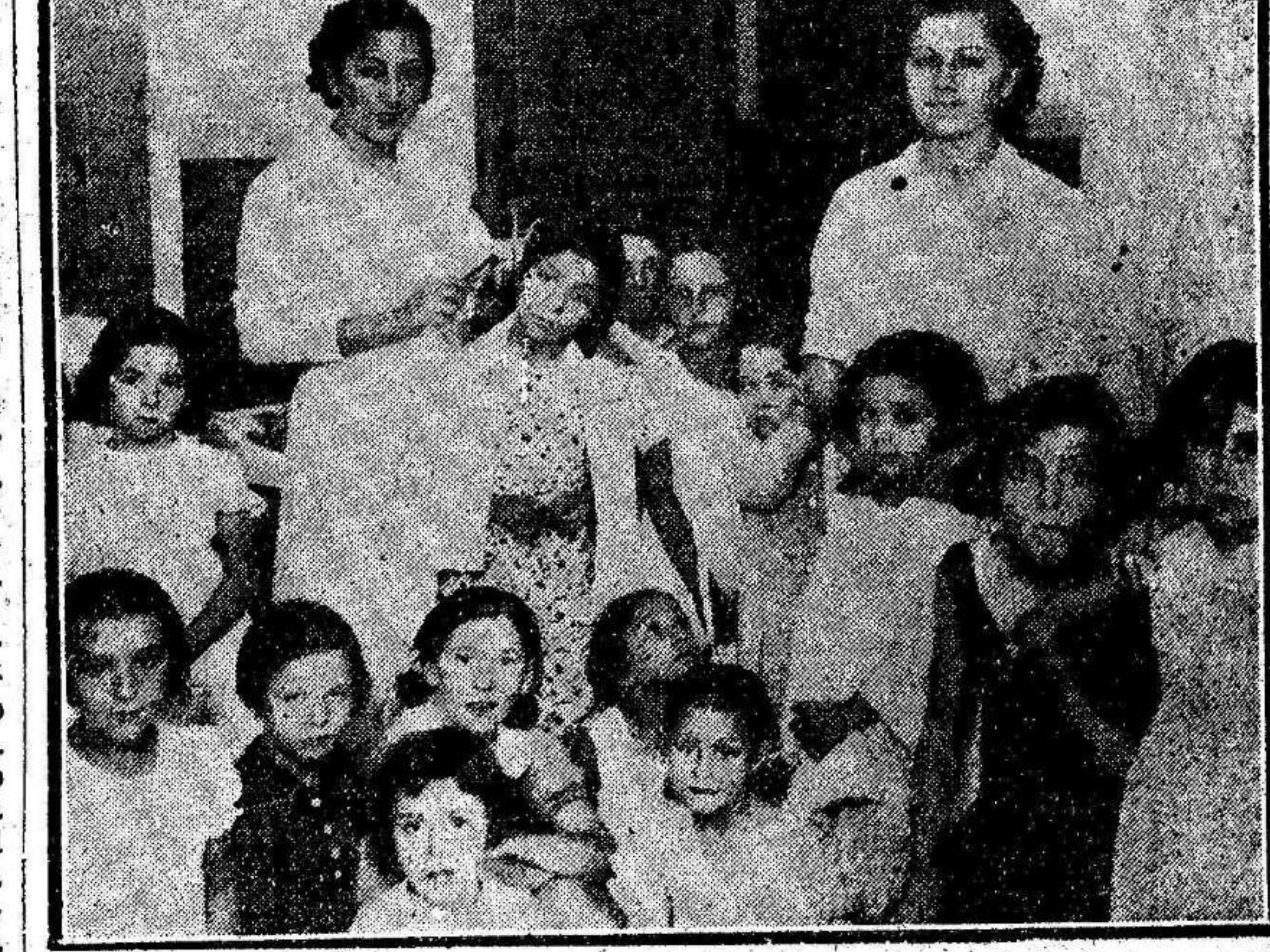
Un grupo de hijos de combatientes colegiados en la Guardería de la Escuela Normal, de Madrid, donde se les atiende con la máxima atención y ternura.

MADRID.—A las cinco menos cuarto de la tarde el Tribunal Popular ha dictado sentencia en la causa vista contra el que fué ministro de la Gobernación, don Rafael Salazar Alonso.