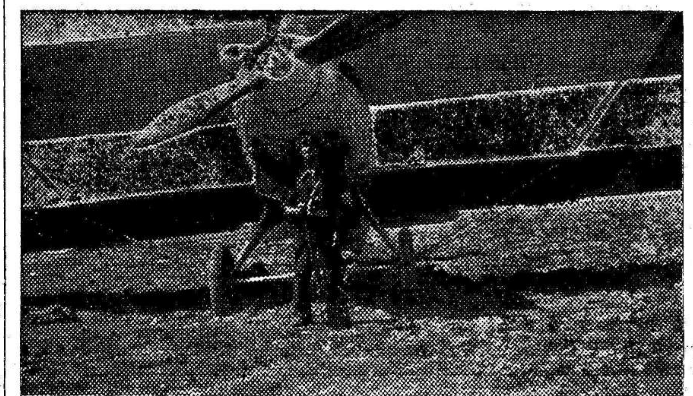
Un aparato de la Base de Guadix, que ha bombardeado eficazmente el palacio arzobispal y el campo de aviación enemigo, destruyendo dos "cazas" fascistas.

A consecuencia de este incidente, y después de haber sido puesto en libertad Leroy, el gobernador civil de San Sebastián ha celebrado una conversación con cierto número de periodistas extranjeros, declarándoles que de ahora en adelante se adoptarían medidas de gran severidad contra todos los periodistas cuya actitud les haga sospechosos de ser enemigos personales del Frente Popular, y por consiguiente del pueblo español, que tan bravamente está defendiendo su libertad con las armas en la mano.