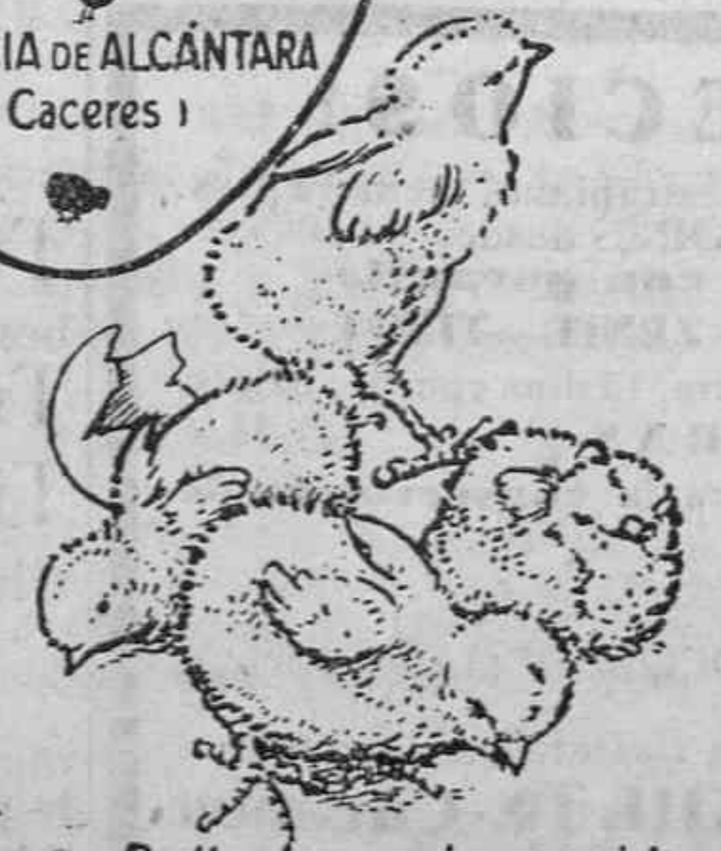
Polluelos recién nacidos