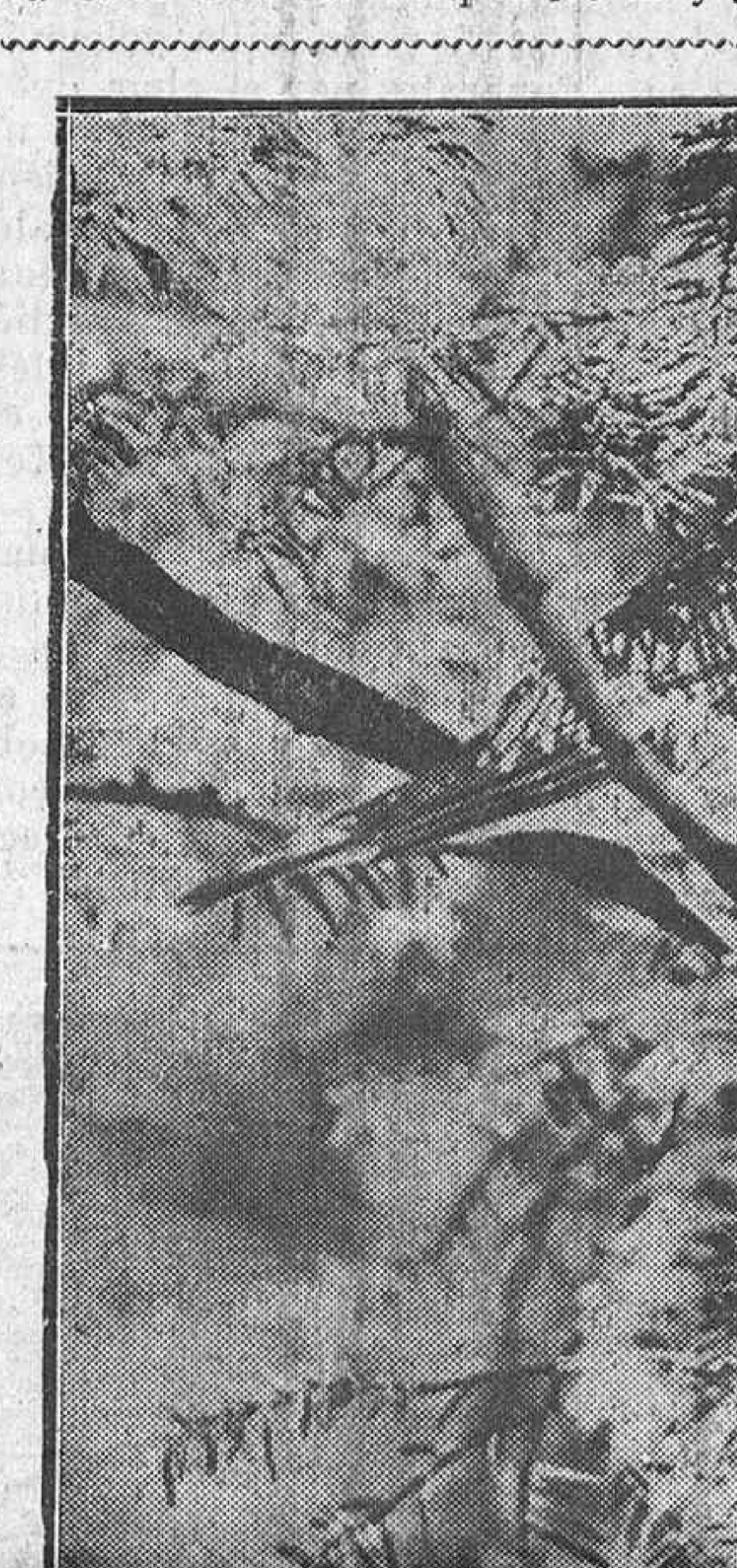
Lanzando al aire una serenata estos tres pequeñuelos desde su nido bajo la mirada vigilante de la mamá