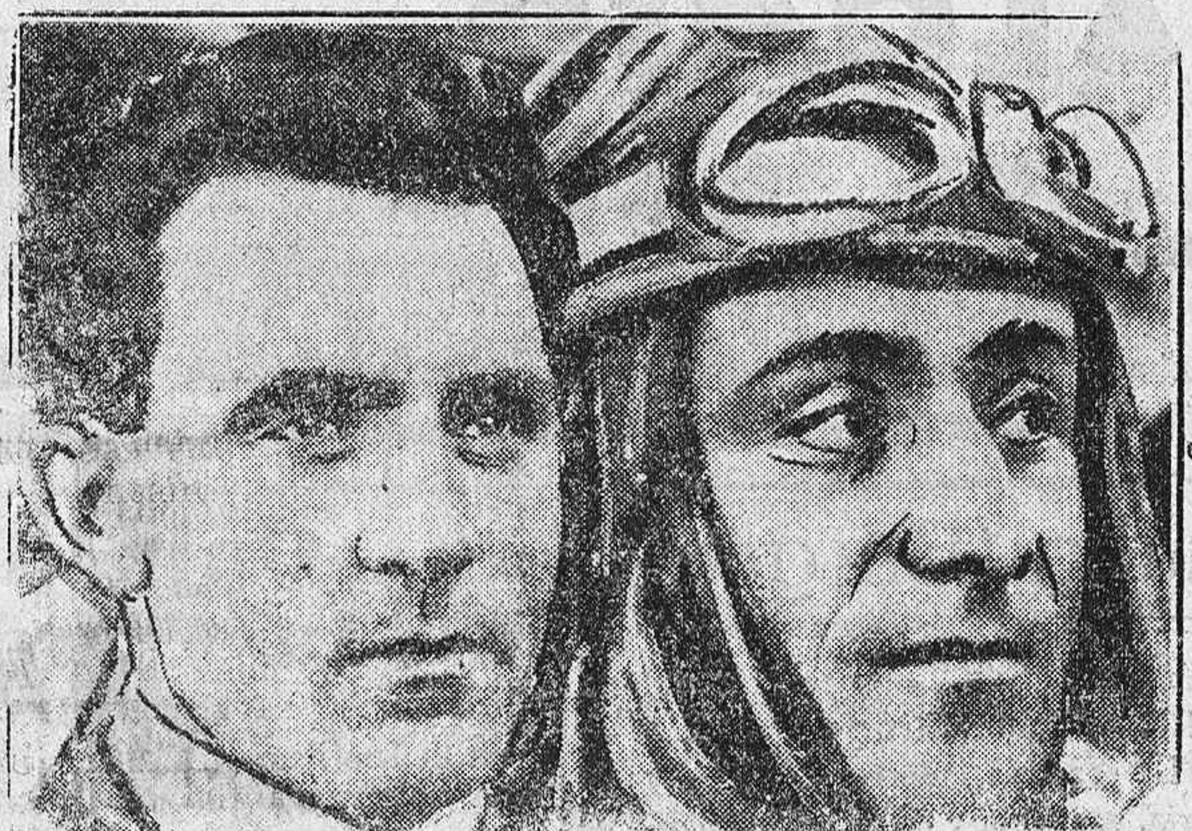
Costes y Bellonte, que de un vuelo acaban de cruzar por primera vez de Oriente a Occidente el Atlántico, momentos antes de su salida del aerodromo de Le Bourget.

En caso de que dicho señor no pueda asistir por no hallarse todavía restablecido de las lesiones que se produjo en un accidente de automóvil, el gobernador encomendará la misión de representar al Soberano al senador don Isidoro La Cierva.