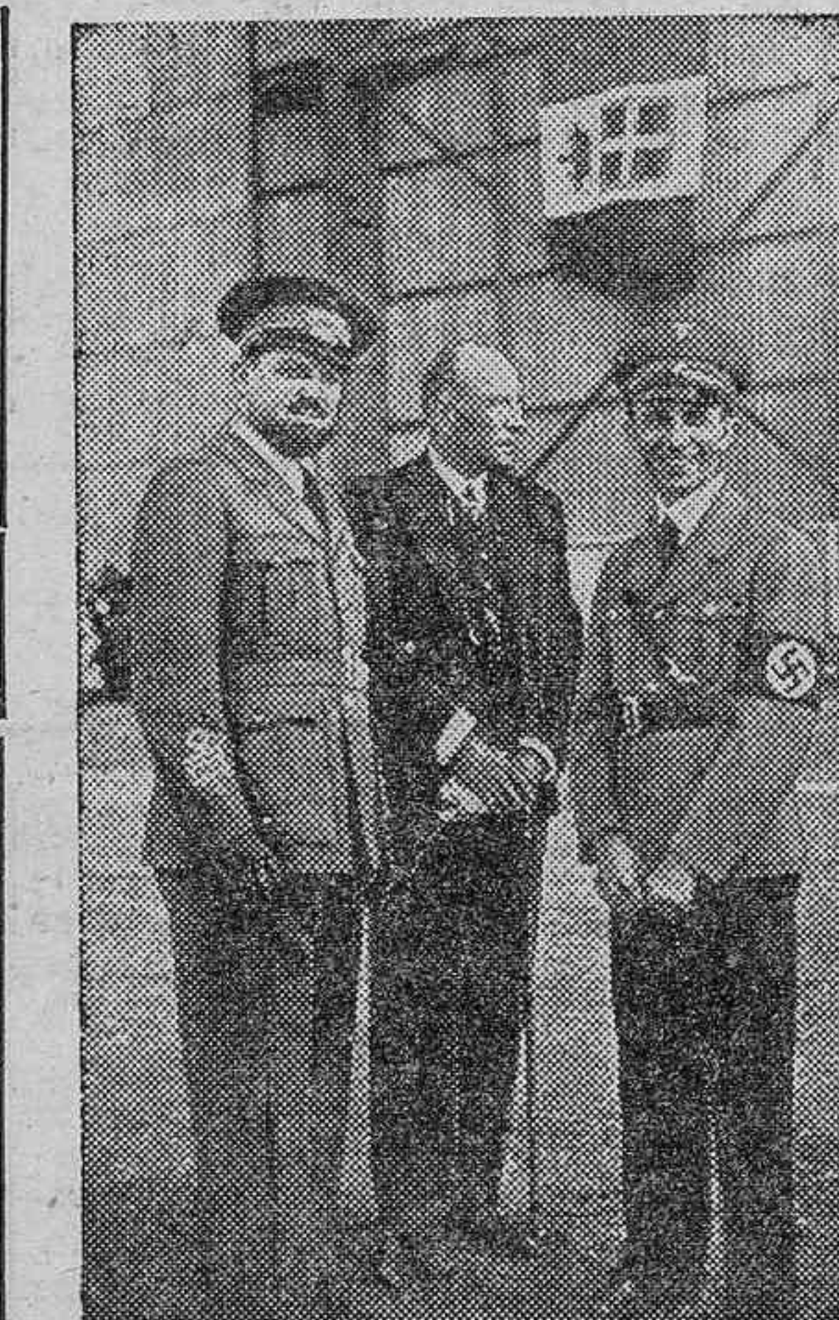
ACTUALIDADES GRAFICAS.—El mariscal Balbo, con el ministro de Propaganda de Alemania, Dr. Goebbels.—Ejercicios de aviación inglesa.