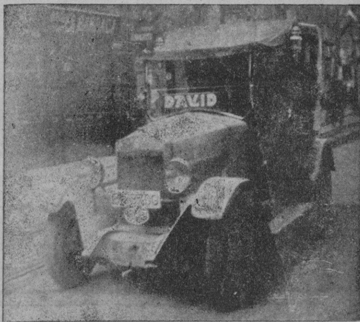
Por nuestras carreteras ruedan 278 taxímetros, de todos los tipos y modelos

como son Melilla (982), Albacete (964), Orense (963), etc.; siendo la más insignificante Avila, que sólo cuenta con 331 vehículos. Además podría seguir dándole datos... Yo seré el responsable si a la hora de la comida, permita que esta se enfríe y hasta reciba una reprimenda de su costilla. El caso no es para menos. De su cálculo a la realidad median... más de tres mil coches. J. M. a Doménech Casi aseguraría que sí. Todo