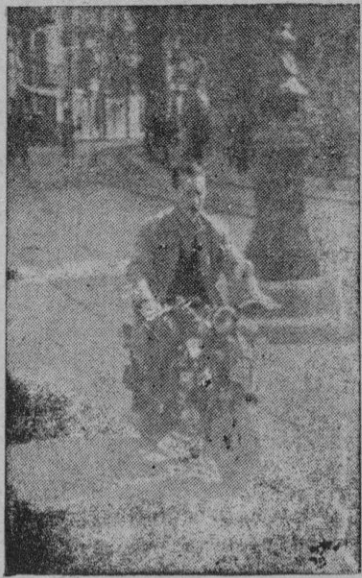
Solamente 193 motos, si no cuentan las estadísticas, son en total, las que meten ruido a todas horas y en todas partes

Es decir que ni existían tantos ni tan pocos como uno se cree. Existen "exactamente"... los ciertos. Ya! Pero a mí me gustaría... "Sí, ya sé: conocer la cantidad, ¿no?" "Exacto. Pues... apunte. Según datos oficiales, facilitados por el Instituto Nacional de Estadística, en su segundo suplemento del año pasado, "ruedañ" por las carreteras de nuestra provincia 4.340 vehículos, cantidad inferior, como usted ve, a aquellos siete mil y pico de que me hablaba. Qué sorpresa! De todas maneras me parece un buen promedio. De los mejores de España. Los isleños poseemos 10'7 coches por cada mil personas; o sea 1'07 por cada cien... Por lo tanto a usted le corresponde, pues, una... una... Sí, no me diga: un foco o una llanta. Eso. Pues mire, estoy satisfecho. Desde hoy cuando vaya en coche iré con la alegría de sentirme "propietario". ¿Y dice usted que somos de los primeros?" "Sí; nos aventajan únicamente Guipúzcoa (14'1), Melilla (13), Barcelona (11'7) y Madrid (11). Todas las demás provincias nos vienen detrás; siendo la última Ciudad Real, que sólo posee un coche por cada mil personas. Algo así como "tocarle" a uno la bocina. Pues me he llevado un chasco, créame... ¡Cuatro mil coches! Perdone... Hemos partido de una base falsa; cuatro mil coches, no... Cuatro mil vehículos, ya que en la estadística van incluidas las motos, los camiones,