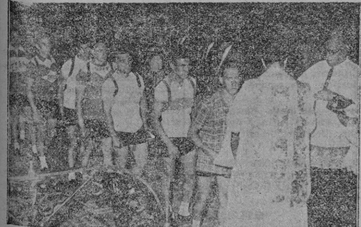
Los corredores, en la Iglesia de San Nicolás, reciben el obsequio de una medalla de Ntra. Sra. de Lluç. después de la misa.