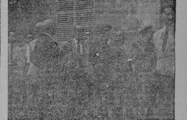
Nuestras primeras Autoridades, militares y civiles, junto a la salida simbólica.

A las 11 de la mañana, en la Iglesia Parroquial de San Nicolás se celebró solemne Misa, en el Altar Mayor, siendo el celebrante el M. Ilre. señor don Sebastián Garcías Palou, Canónigo de la Santa Iglesia Catedral Basílica.