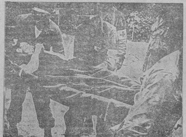
Las tropas de Sanidad americanas se han distinguido por su heroísmo en la campaña de Corea. Aquí aparecen evacuando a un soldado herido