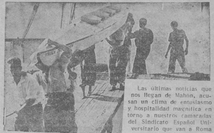
Las últimas noticias que nos llegan de Mahón, acusan un clima de entusiasmo y hospitalidad magnífica en torno a nuestros camaradas del Sindicato Español Universitario que van a Roma en piragua. En Mahón descansan ahora antes de dar el audaz salto a Cerdeña. Mañana publicaremos una crónica de nuestro corresponsal en Menorca en la que se narran detalles del recibimiento y la estancia de los heroicos navegantes.