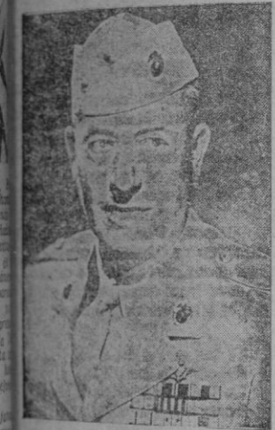
El general de brigada Thomas J. Cushman.

El portavoz agregó que si todas las unidades cuentan con un número normal de hombres, los rojos disponen de unos cien mil soldados. Añadió que hay que descontar de dicha cantidad veinte mil bajas habidas por los comunistas y que no han sido cubiertas.—Efe.