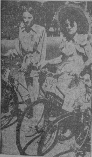
Madrid. — Un conjunto de bellas participantes con sus máquinas