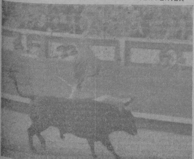
Madrid. — Un momento de la grave cogida de Antonio Bienvenida en la Plaza de Toros de Madrid.