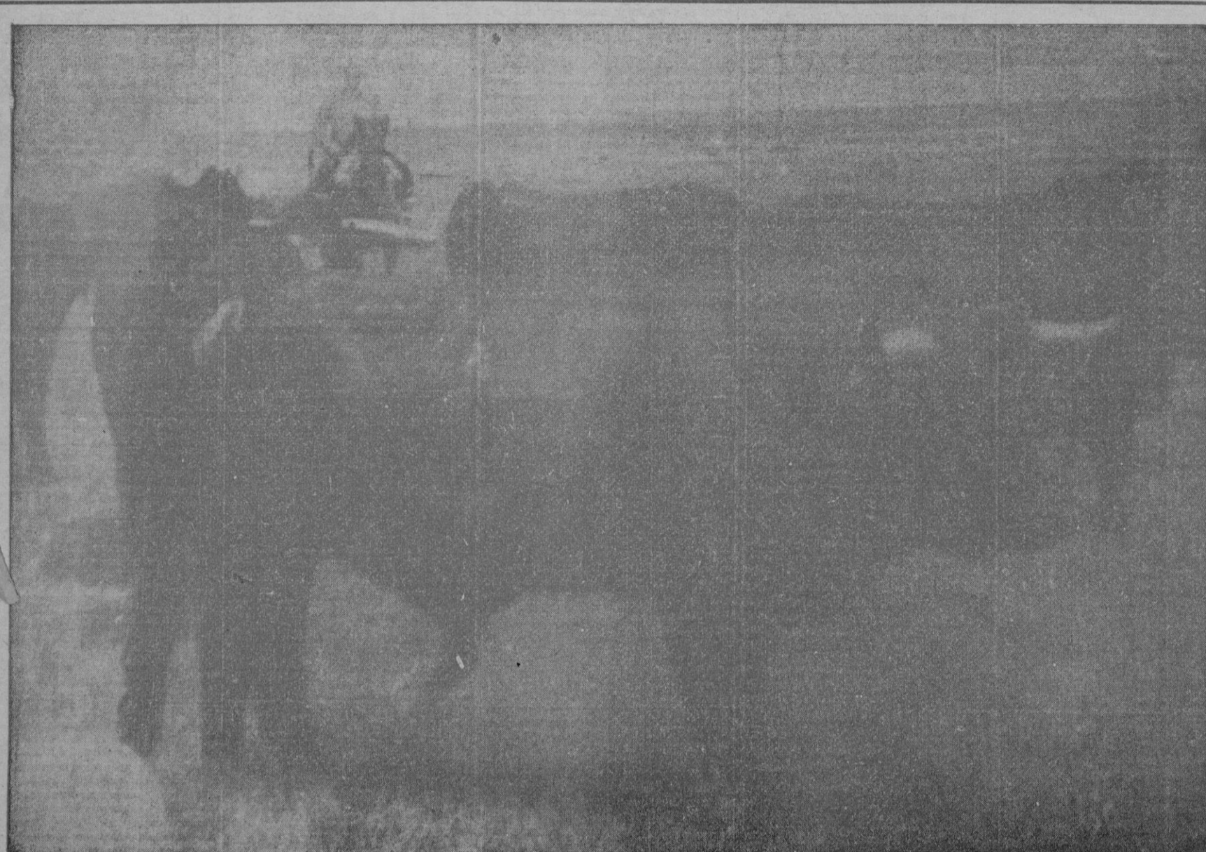
Los toros que hoy a las 7 y media serán descajonados en el ruedo de la Plaza y lidiados el próximo día 1.º de Junio por los diestros «Pericás», «Parrita» y «Rovira»