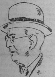
John J. Parker, Juez norteamericano que representa a su país en el Alto Tribunal Aliado de Nuremberg y que ha de sentenciar en el proceso incoado a los criminales de guerra germanos