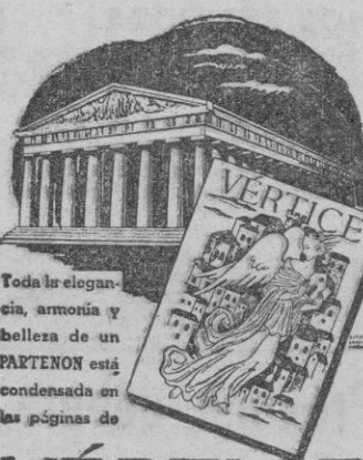
Toda la elegancia, armonía y belleza de un PARTENON está condensada en las páginas de VÉRTICE

BARCELONA. — Según noticias, llegará a Barcelona procedente de Génova el vapor «Plus Ultra» en el cual regresan a España 604 repatriados que se encontraban en la Europa Central. Entre ellos figuran Consules y familiares suyos, con tal motivo el Jefe de Policía ha establecido una oficina de identificación para hacer la filiación a los pasajeros. Auxilio Social instalará lo necesario para atenderlos debidamente. En Barcelona se les entregará una cantidad en metálico, artículos alimenticios y billetes de ferrocarril hasta sus respectivos puntos de residencia. Se espera que el «Plus Ultra» arribe al puerto de Barcelona el sábado próximo. — Cifra.