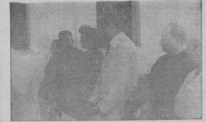
El Sub-Jefe provincial del Movimiento, dirige un saludo de despedida a las alberguistas del S. E. M.

Ejercicios gimnásticos.-Una emisión de radio improvisada y una audición de coros