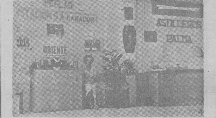
Una vista del Stand de Baleares en la Feria del Mar, celebrada en Vigo