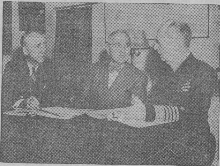
Una reciente fotografía del Presidente Truman conversando con el Almirante Leahy y el Secretario de Estado, Byrnes

Después de mil novecientos cuarenticinco la existencia de algunos alimentos de primera necesidad seguirán siendo demasiado reducidas para la demanda. Por ejemplo, añadió, durante varios meses el mundo dispondrá de menos grasas, aceites y azúcar, del que necesita y probablemente deberá continuar en 1946 los racionamientos de dichos artículos en nuestro país. No deseamos avanzar con tanta rapidez como para tener en peligro la distribución ordenada de los productos en que hemos basado nuestra vida durante la crisis. Permitase agregar que en ningún caso deben dejarse sin efecto las restricciones y el racionamiento si al