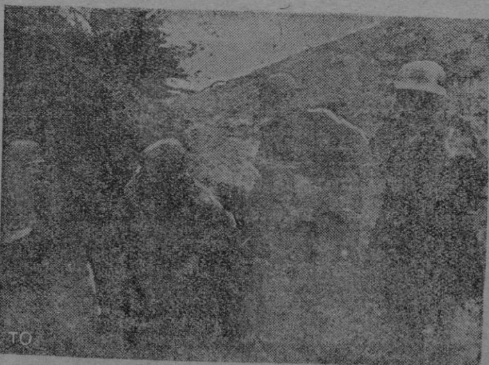
Granaderos alemanes en un momento de descanso en los alrededores de Bastogne, donde se está combatiendo duramente.