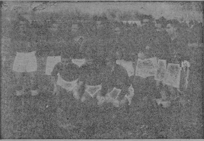
El equipo del Oviedo que fué vencido por el Constancia.