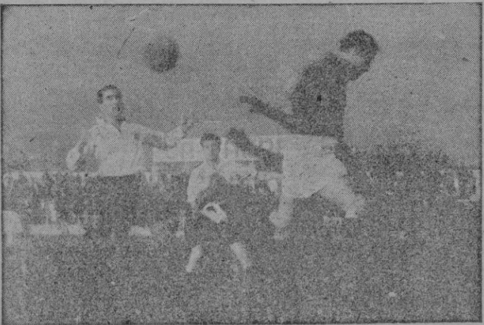
Donjany salta en remate de cabeza del delantero centro del Oviedo.