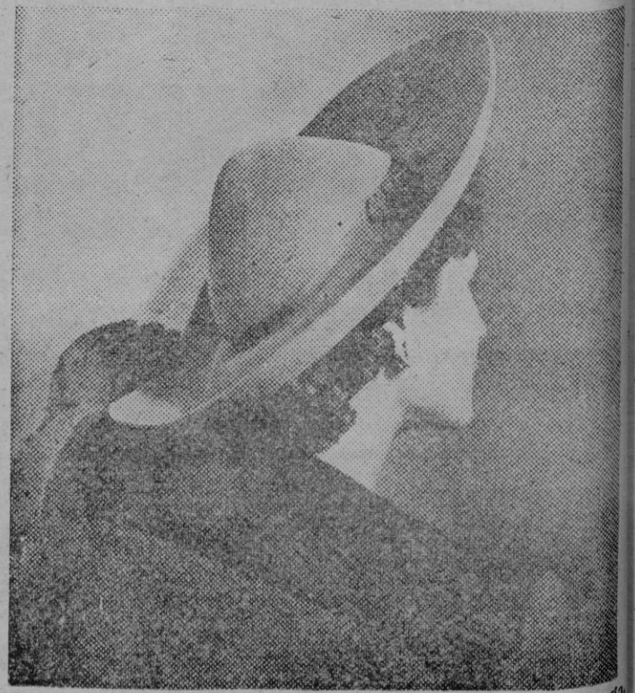
Visto desde atrás este sencillo sombrero, de color gris o beige, con su copa esférica y anchas alas, un tono juvenil, bajo el cual las miradas no pueden ocultarse en sombras o tules...

Tal vez algún humorista inventó lo que es excelente prestigio el recibir dinero el día inicial del año. Y agrega que cuanto mayor es la cantidad, mejor. Esto no deja de tener su especial filosofía, ya que a nadie le disgusta recibir tales presentes. Lo triste es cuando se reciben ofertas a pagar, riesgo un poco evitado por ser día festivo.