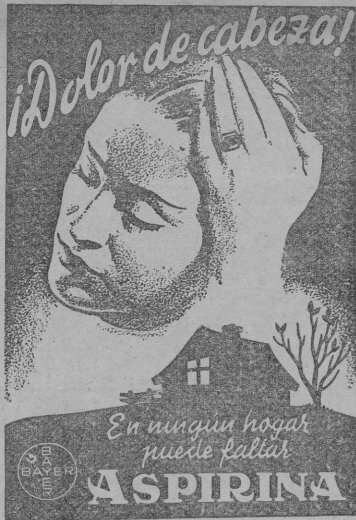
Aprobada por la Censura Sanitaria n.º 2503

cabo de una semana se dió cuenta de la absoluta insuficiencia de sus argumentos y tuvo que renunciar a su empeño generoso.