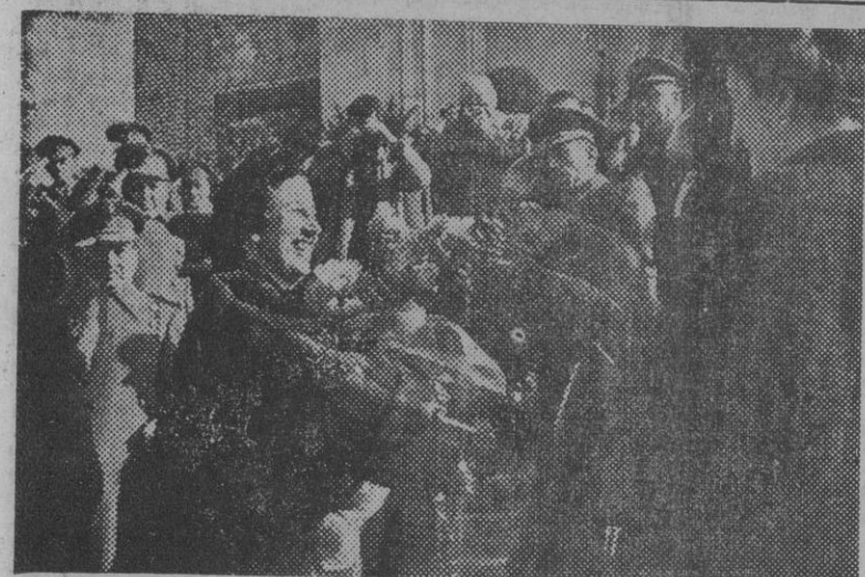
La esposa de S. E. el Jefe del Estado, doña Carmen Polo, es saludada por las personalidades que asistieron a la ceremonia religiosa en honor de Santa Bárbara, Patrona de la Artillería.

La fiesta del Arma de Artillería en Madrid