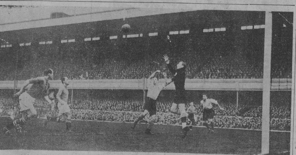
Un momento del encuentro internacional de fútbol disputado en Londres, en que Inglaterra venció por 6 a 0 a Suiza. En la fotografía un delantero inglés y el portero suizo esperan un balón, que lanzará el inglés y marcará el primer tanto para su equipo.