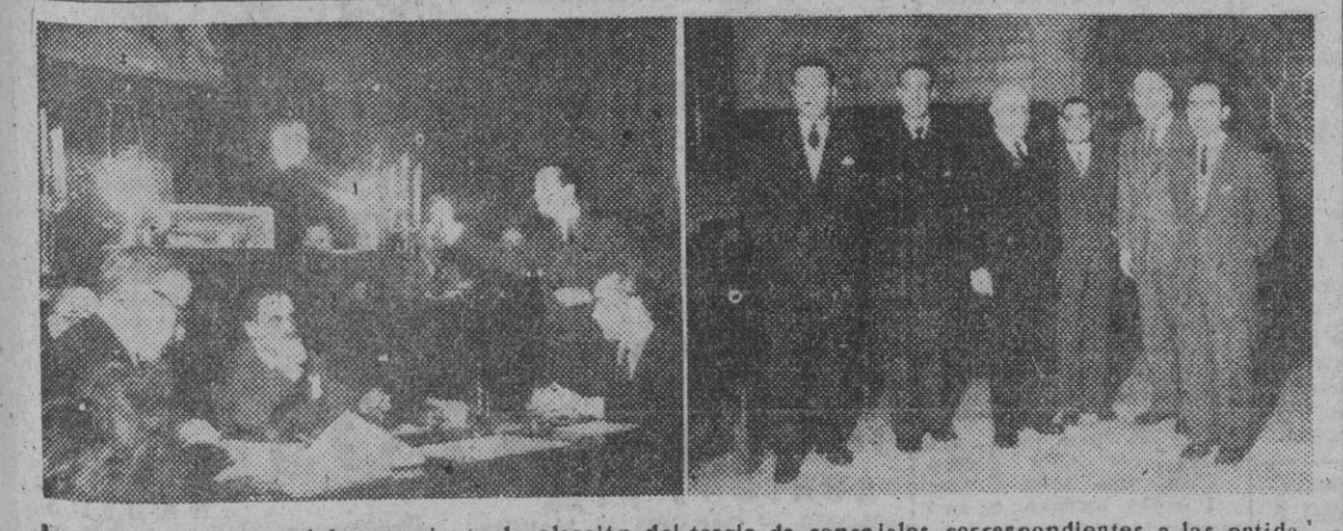
Ayer tuvo efecto en el Ayuntamiento la elección del tercio de concejales correspondientes a las entidades culturales, económicas y profesionales. He aquí los concejales elegidos y un momento de la votación.