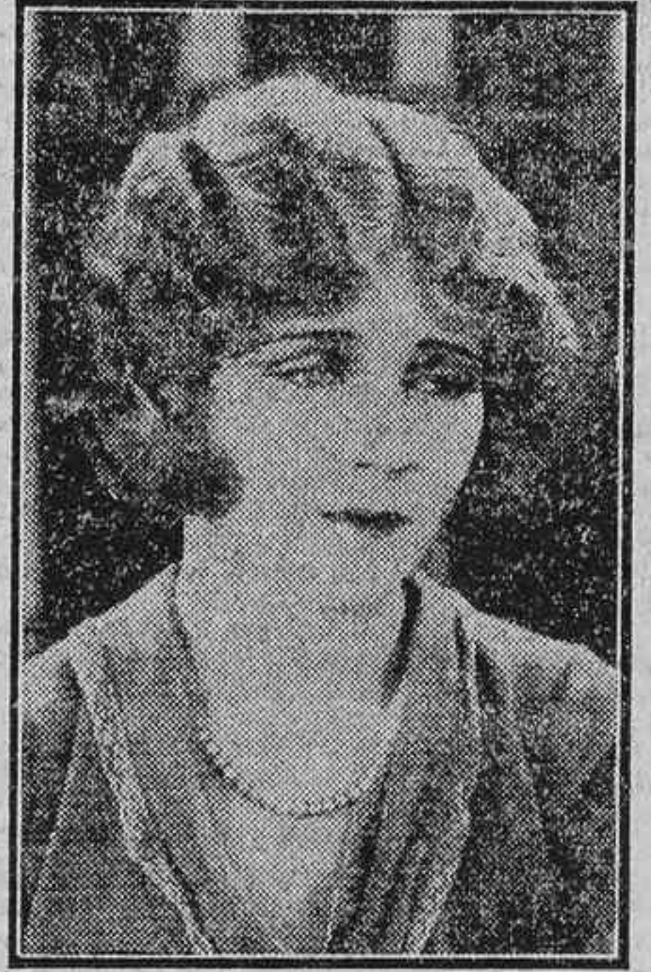
La dramática actriz yanqui Eileen Percy

Cómo se hace un afims En una película reciente, algunas de cuyas escenas se desarrollan en el Coliseum, vieja ruina donde vivieron los Césares de la esplendorosa Roma, fué preciso, con ayuda de policías y soldados, tomar todas las precauciones que conducen al mismo para dejar paralizado el tráfico normal a fin de no imposibilitar la filmación de las escenas que en él tienen lugar. Teniendo en cuenta lo difícil que es para la caballería simular cargas contra la muchedumbre en calles asfaltadas, se le facilitó al direc-