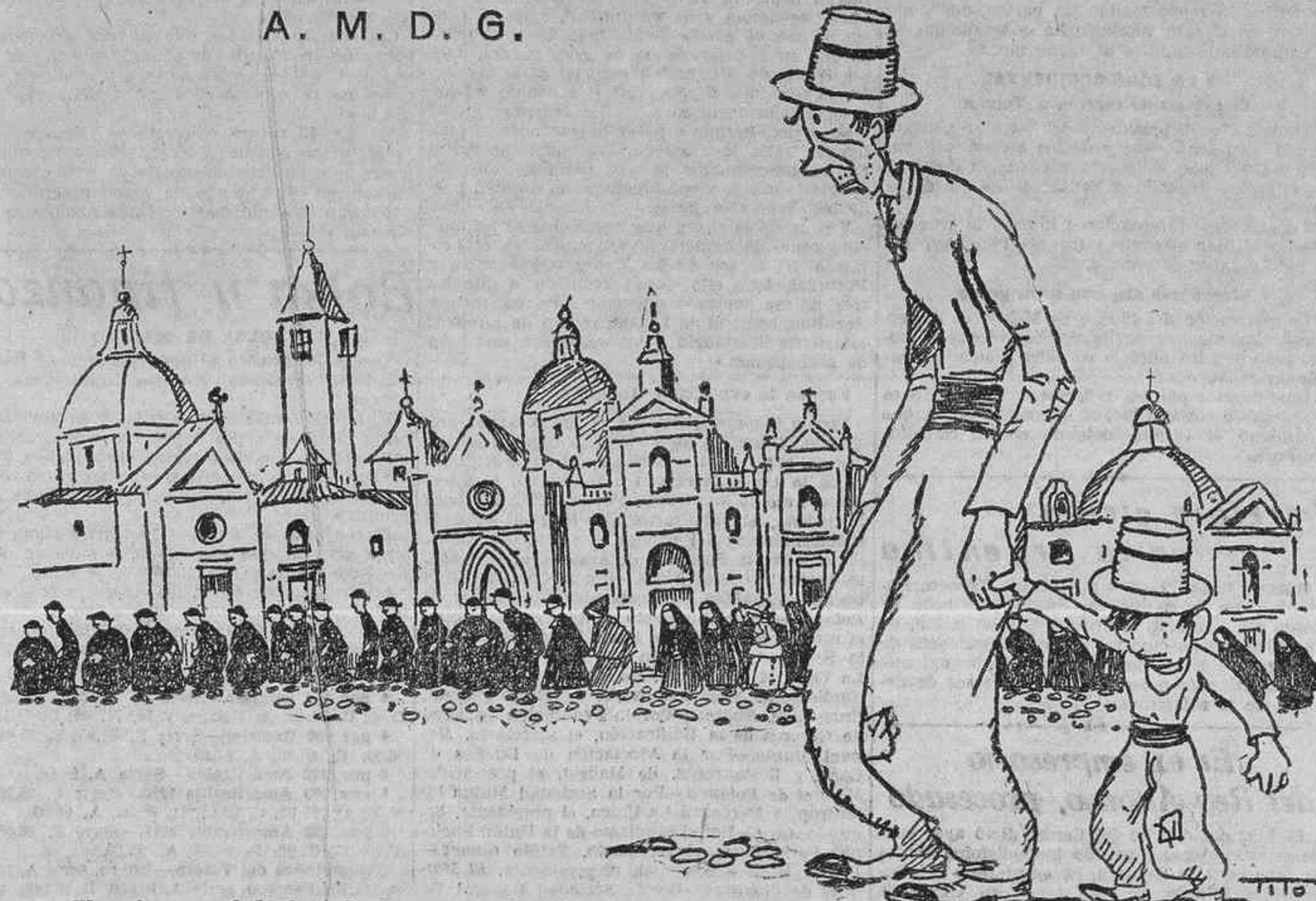
—Y estamos dejados de la mano de Dios!..