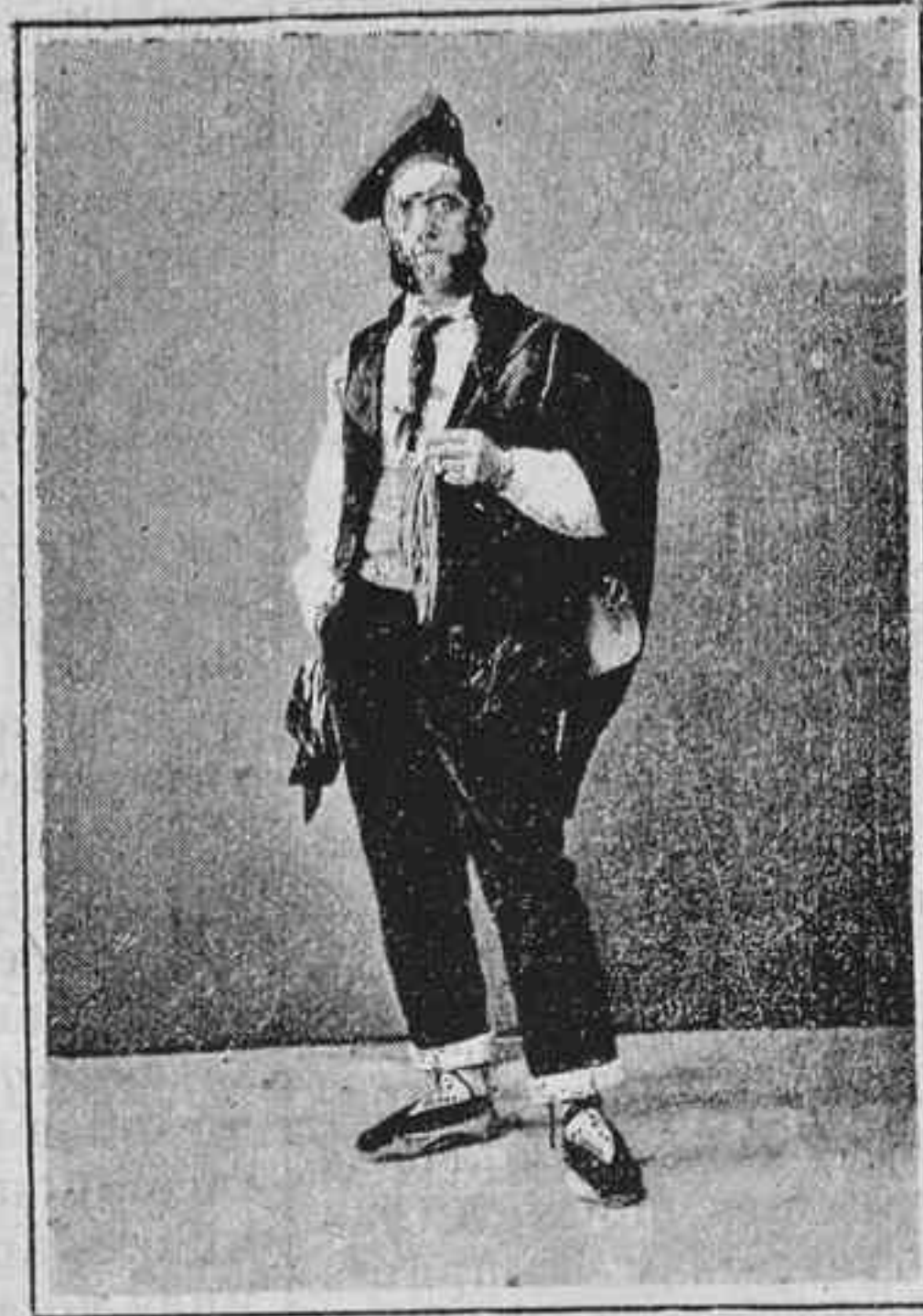
Las pubillas y 'ls hereus.