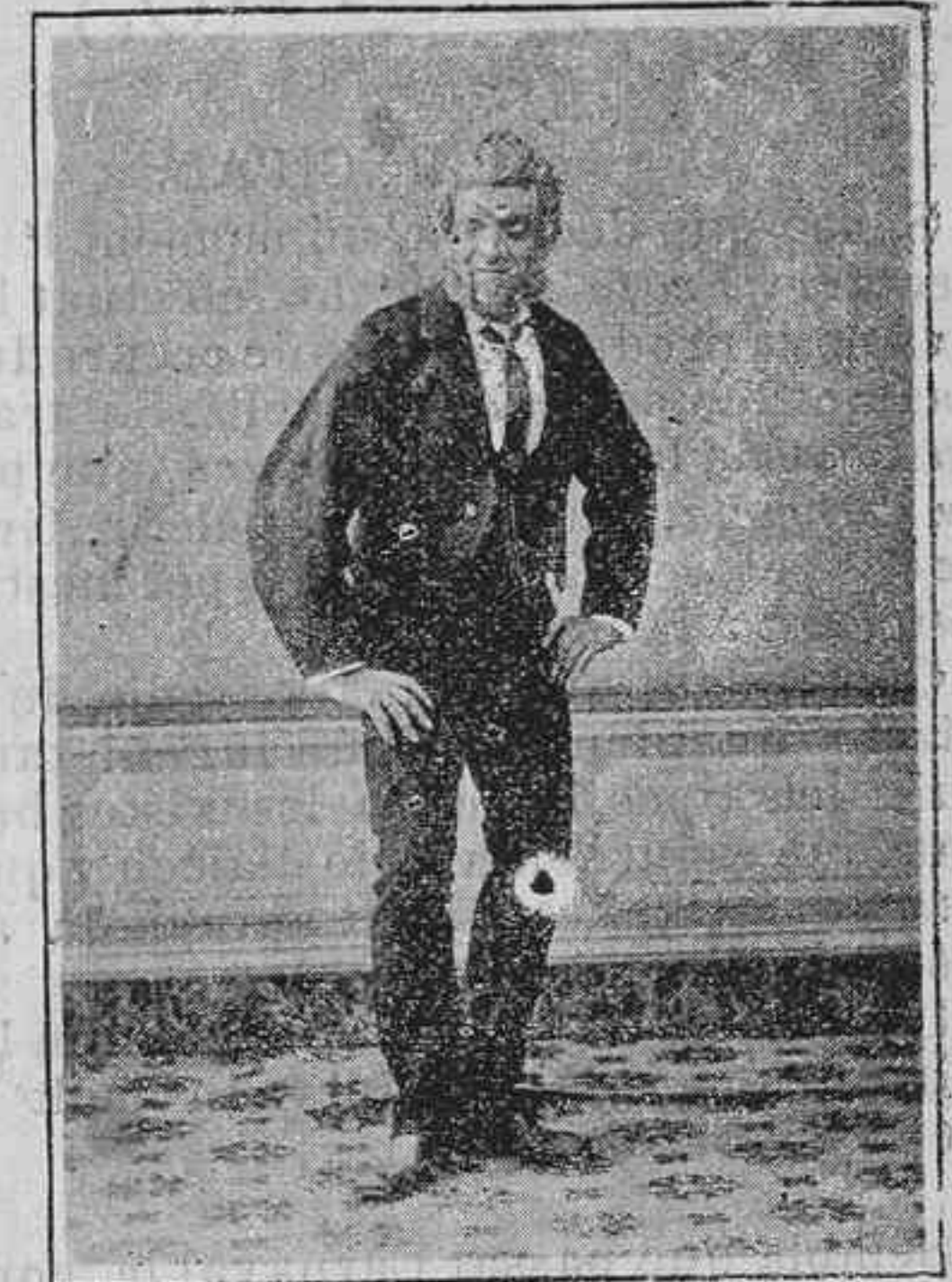
Los tres toms.

y després un altre, sense denotar aquella gent de bronze, lo més petit cansament.