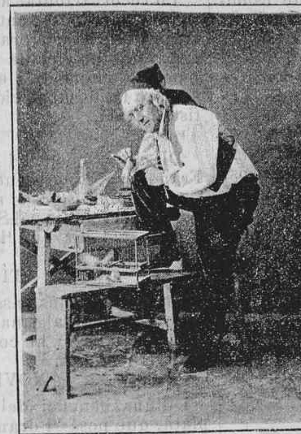
Una noya es per un rey.