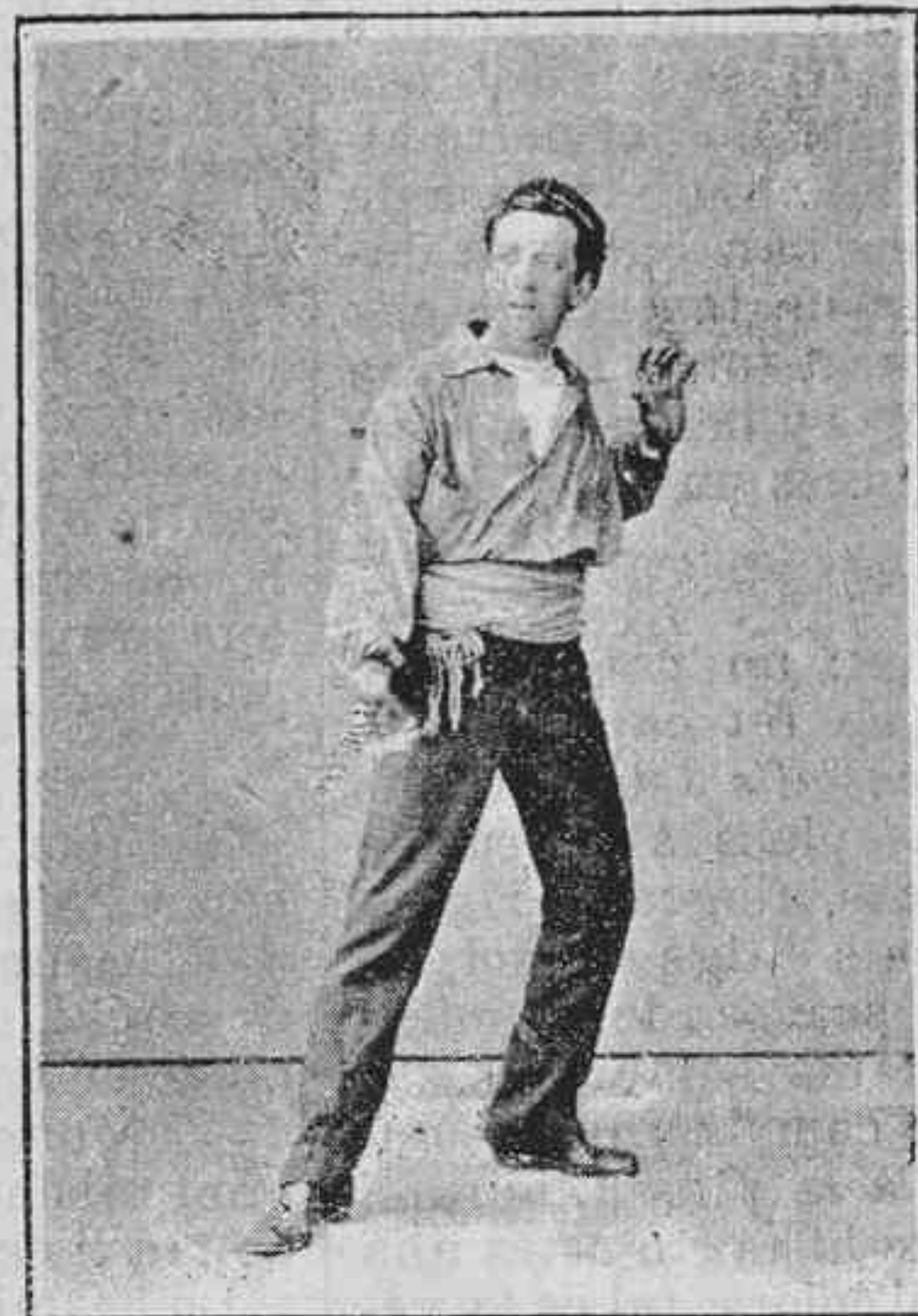
Un embolich de cordas.