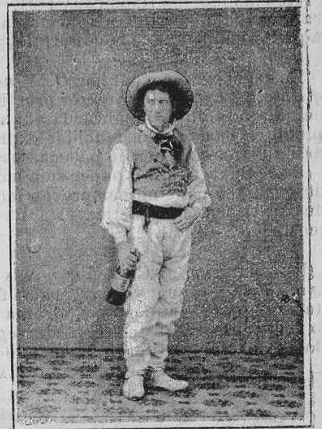
La pajesca d' Ibisca.