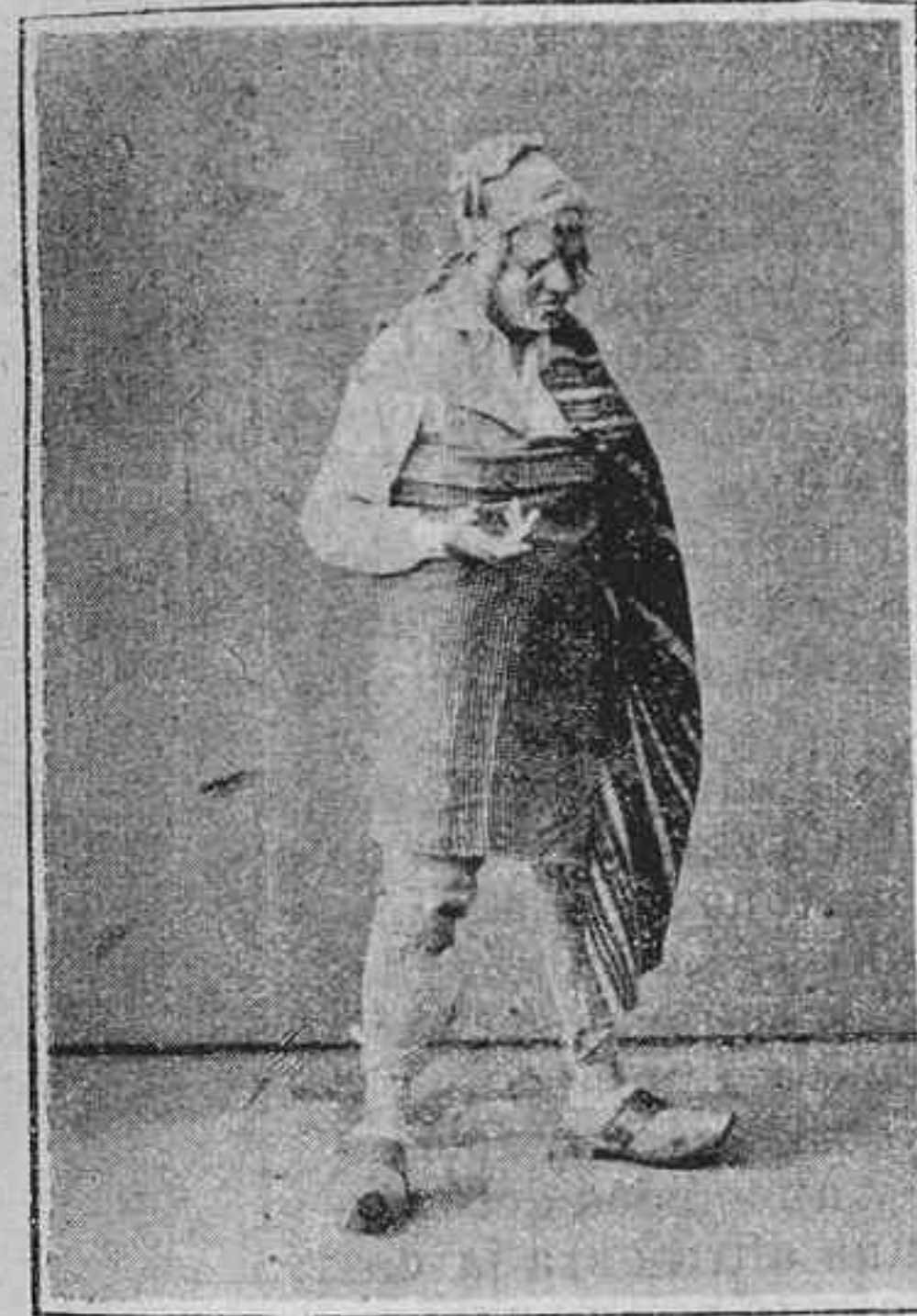
Senyora y majora.