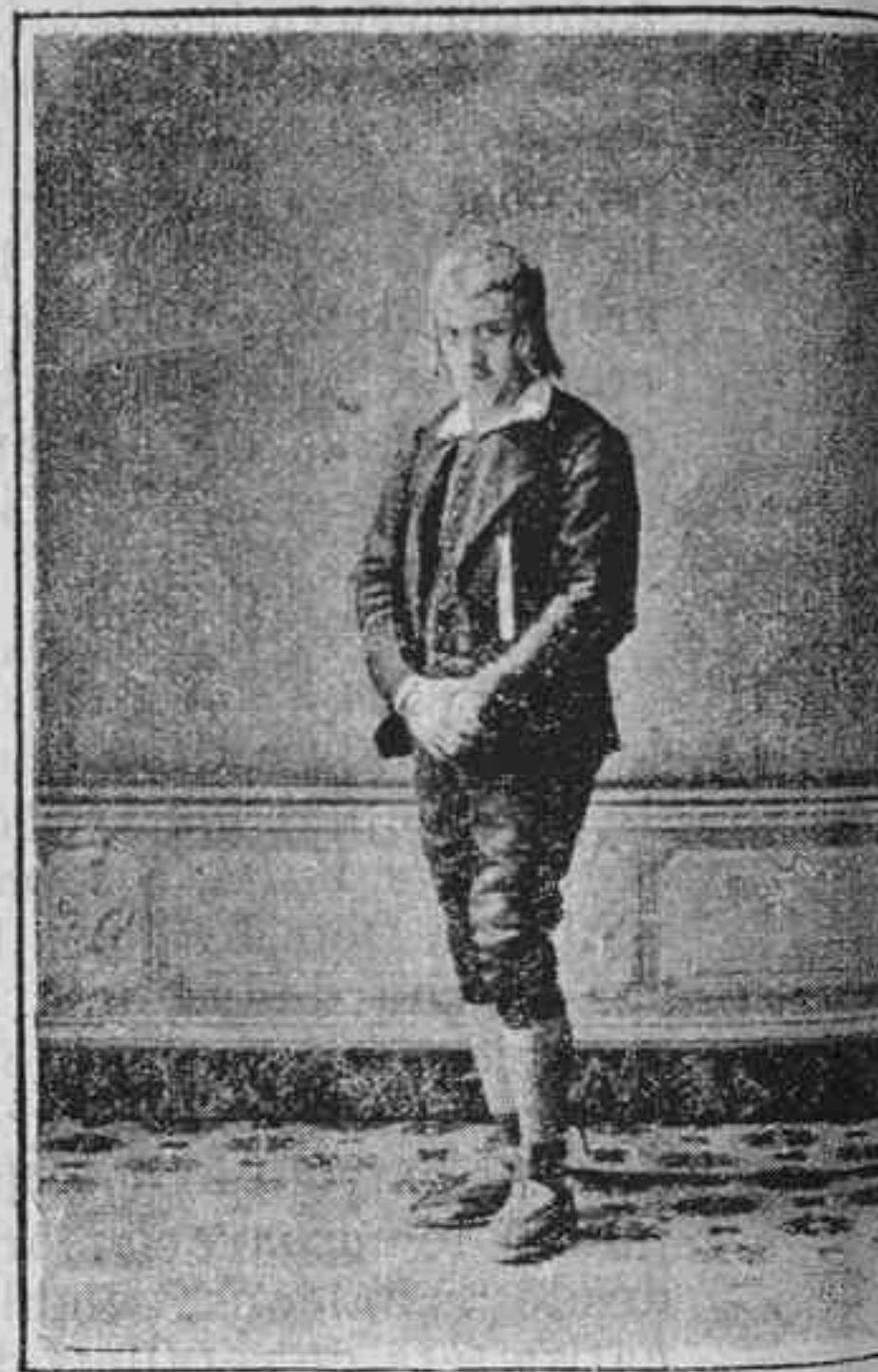
Lo Rector de Vallfogona.