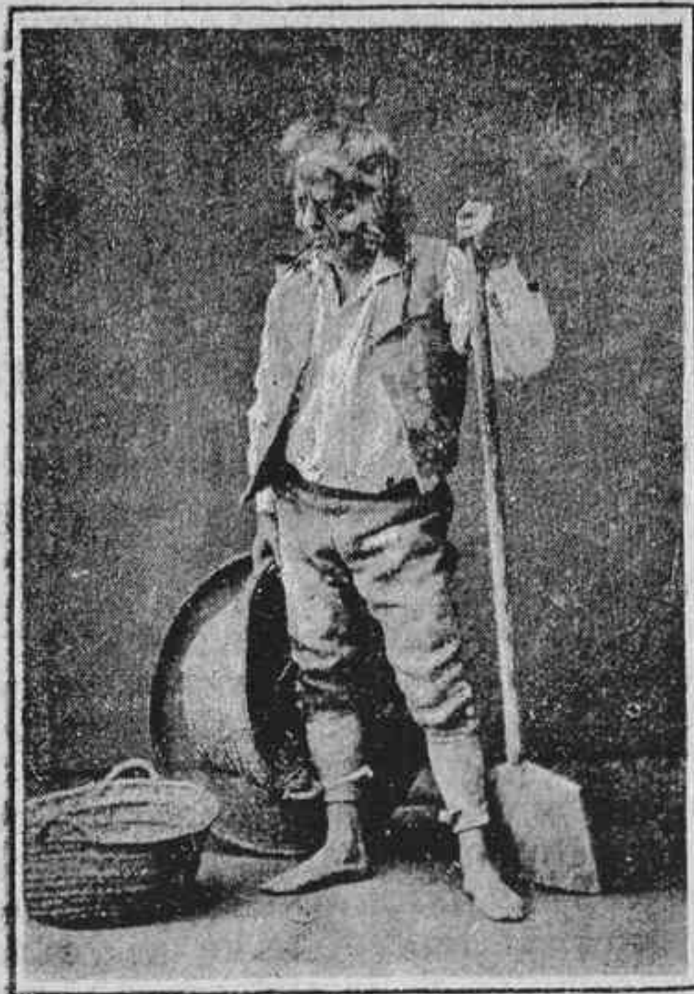
Senyora y majora.