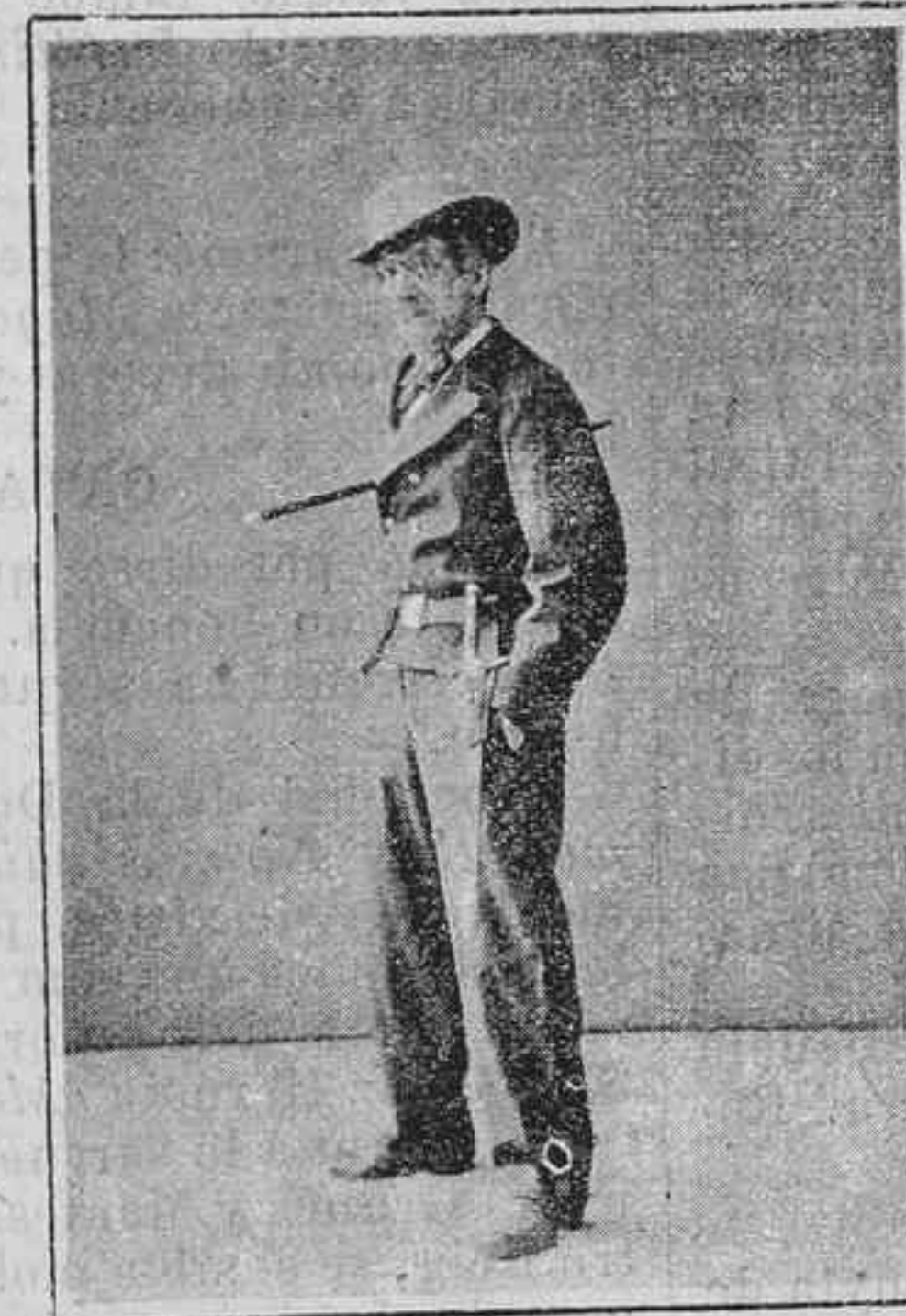
Lo jardí del General.