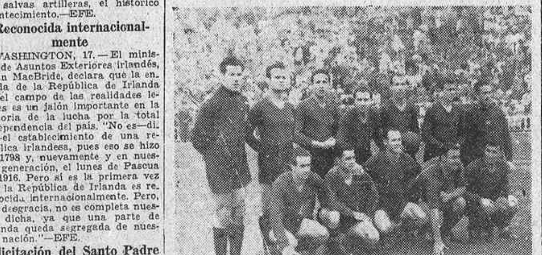
He aquí el equipo del Barcelona, que después de su victoria de ayer sobre el Español ha vuelto a conquistar el título de campeón de Liga.

LA REAL SOCIEDAD Y EL MALAGA QUEDAN INCORPORADOS A LA PRIMERA