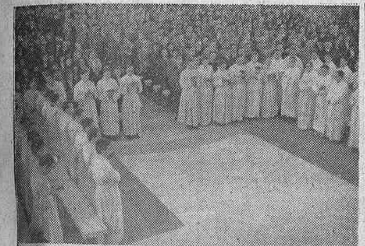
El millar de estudiantes católicos franceses llegados a España para conocer nuestra Semana Santa...

CELEBRAN POR PRIMERA VEZ MISA TRES DOMINICOS NORTEAMERICANOS, ORDENADOS EN AVILA Y SALAMANCA