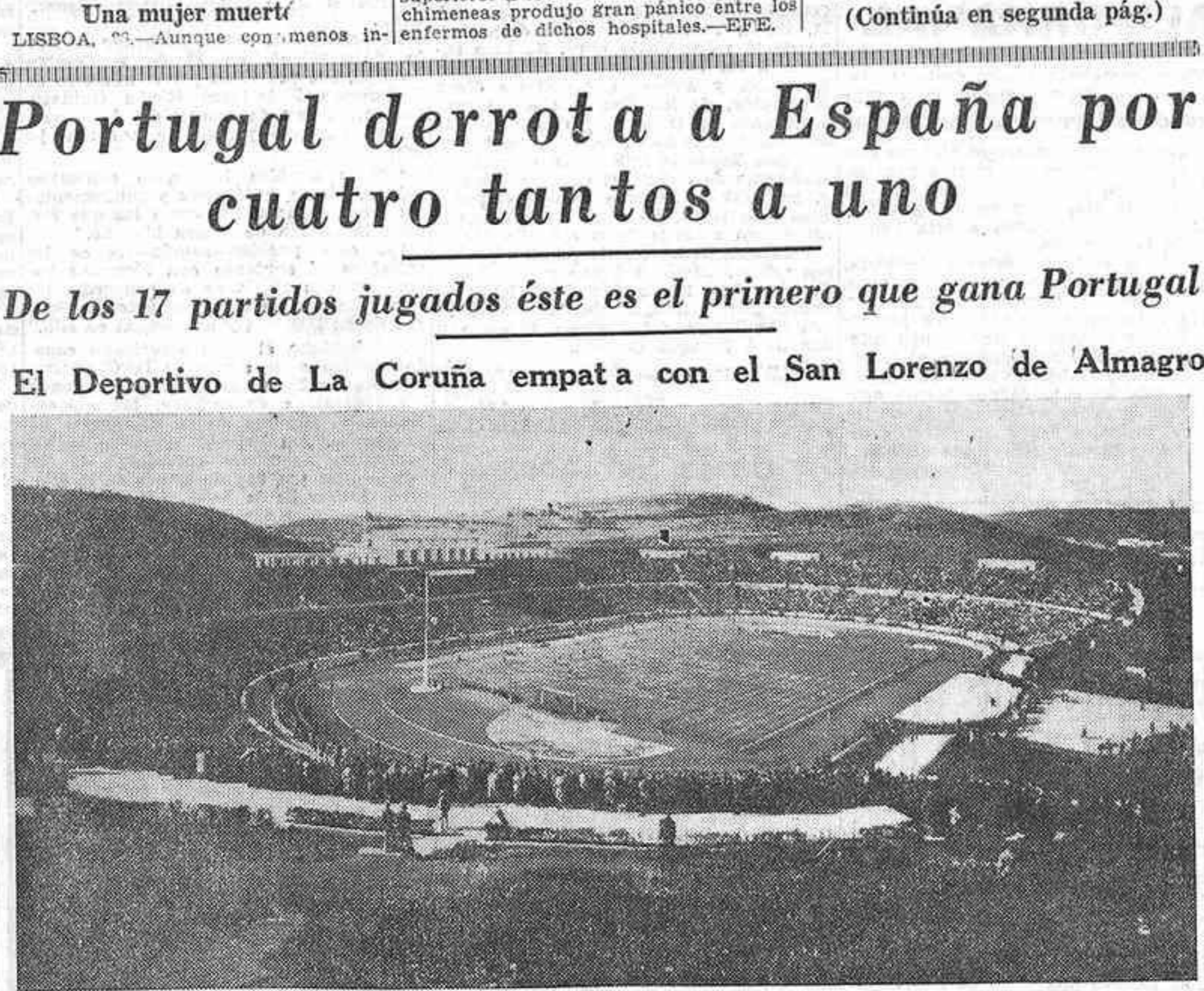
Vista general del Estadio Nacional de Lisboa, en el que, con el resultado de cuatro tantos a uno a favor del equipo lusitano, se jugó ayer tarde el XVII encuentro internacional entre los equipos de los dos países peninsulares.

El Deportivo de La Coruña empató con el San Lorenzo de Almagro