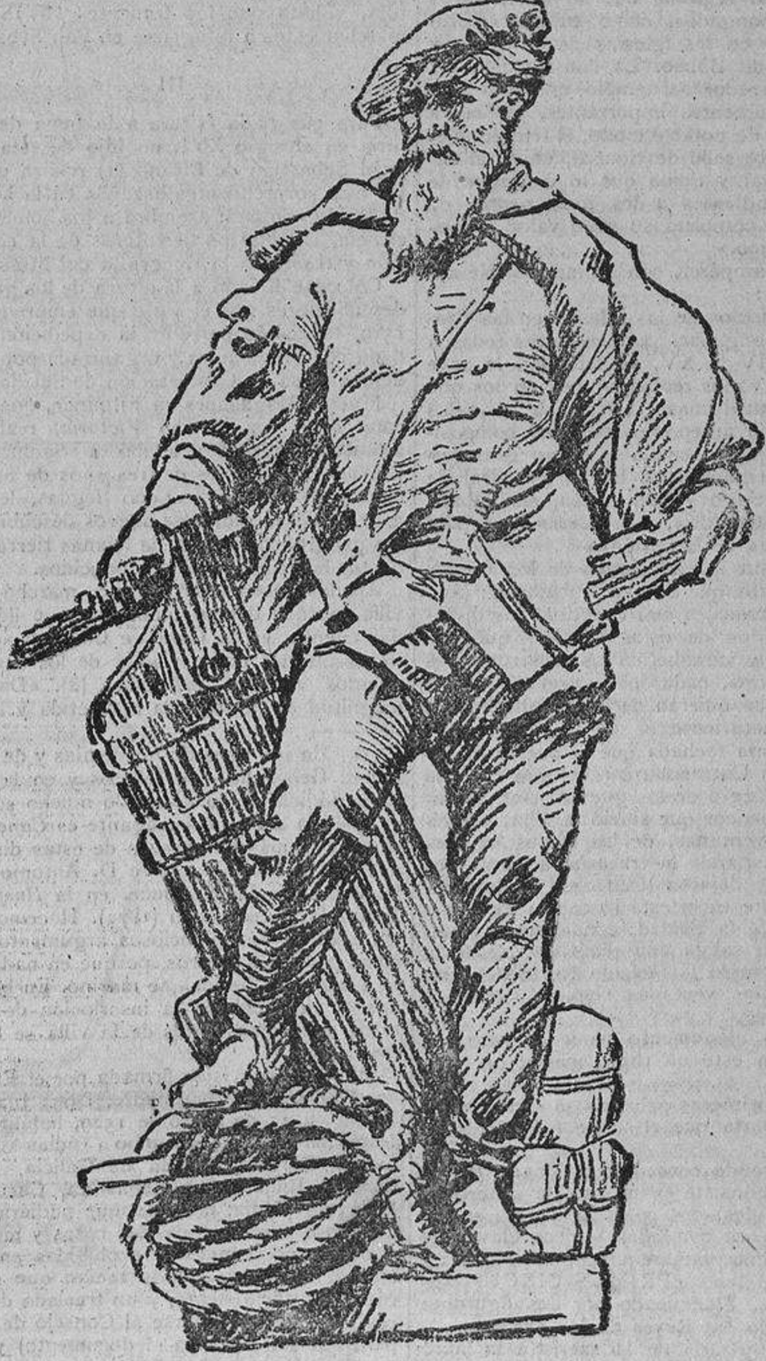
Sebastián Elcano.—Escultura de Bellver.