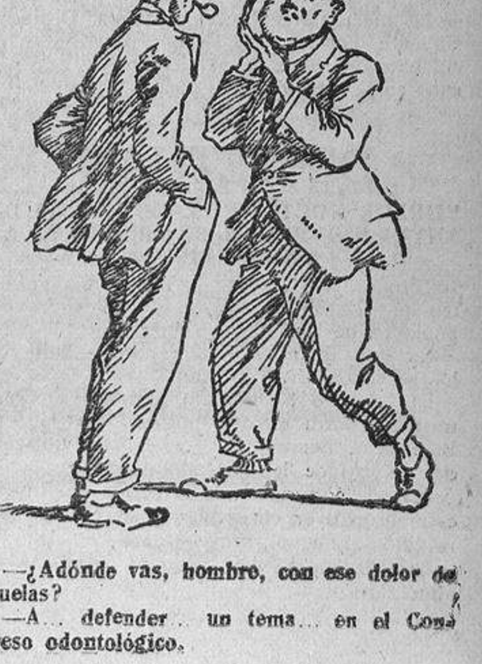
—¿Adónde vas, hombre, con ese dolor de muelas? —A... defender un tema... en el Congreso odontológico.