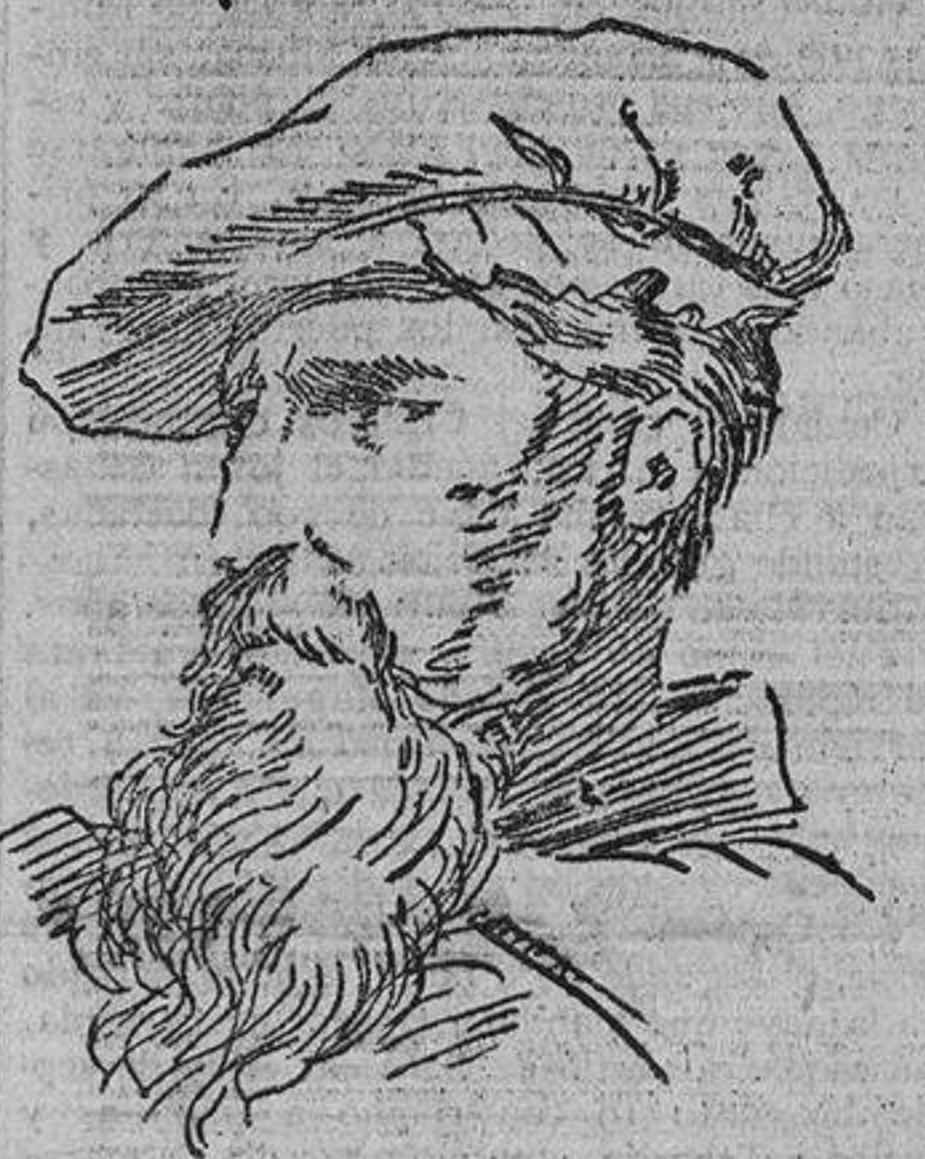
Juan Sebastián Elcano.

La villa de Guetaria, de antiquísima fundación, y una de las plazas guipuzcoanas fortificadas por Alfonso VIII, empezó a adquirir importancia en el siglo XIV, al figurar sus barcos en las luchas navales contra Inglaterra, intervinieron sus representantes en los tratos de paz con aquella nación en el año 1353 y reunirse en su templo parroquial las Juntas forales en 1397. En el siglo XV llegó Guetaria a un alto grado de florecimiento y de riqueza, conti-