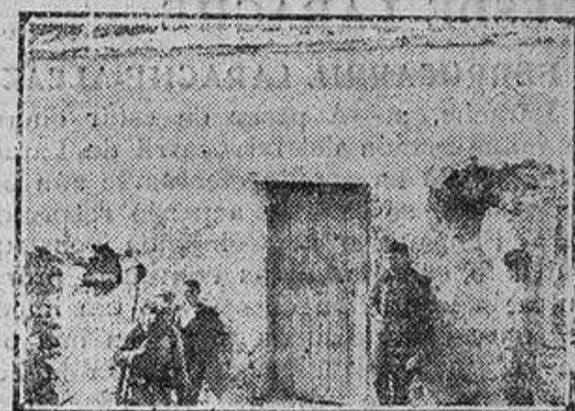
Dos impactos de cañón en una casa del Peñón.

En otra ocasión, cuando los convoyes des-