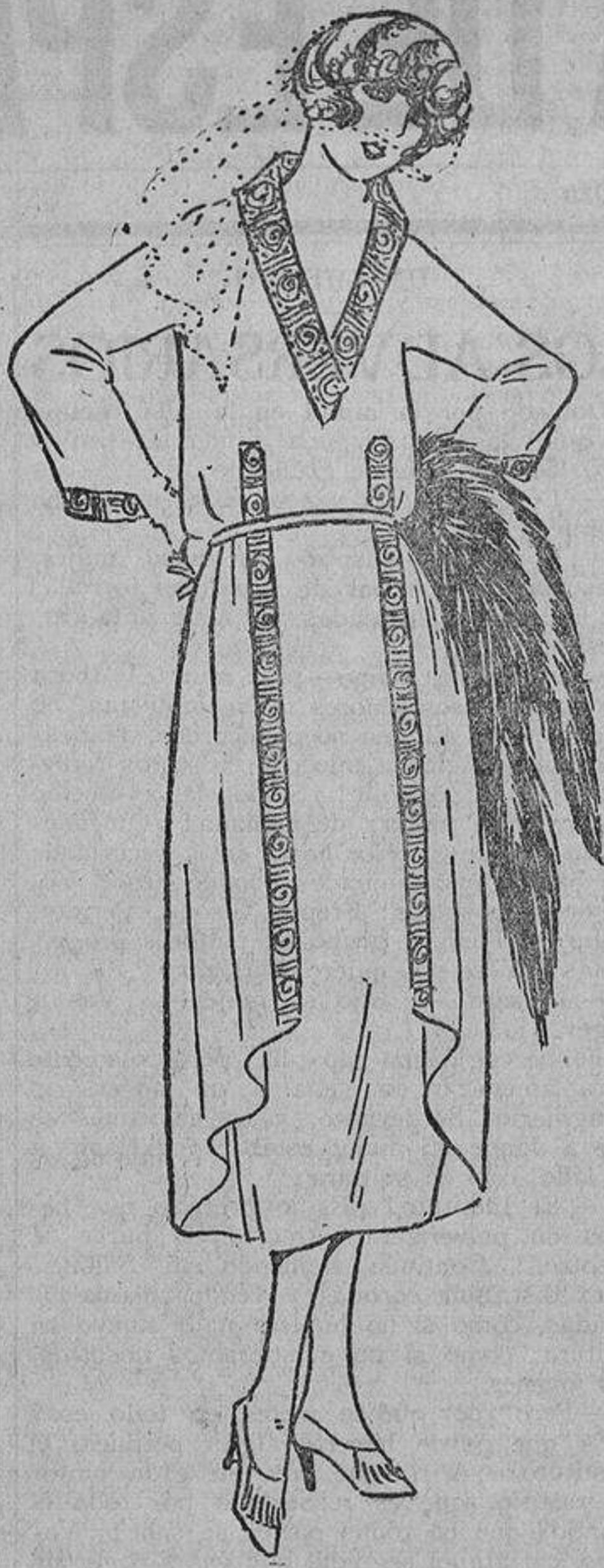
Realmente la sobrefalda nace desde la cintura; esos bordados que nacen en el cuerpo están para despistar. Azul marino, bordados y forro rojo.