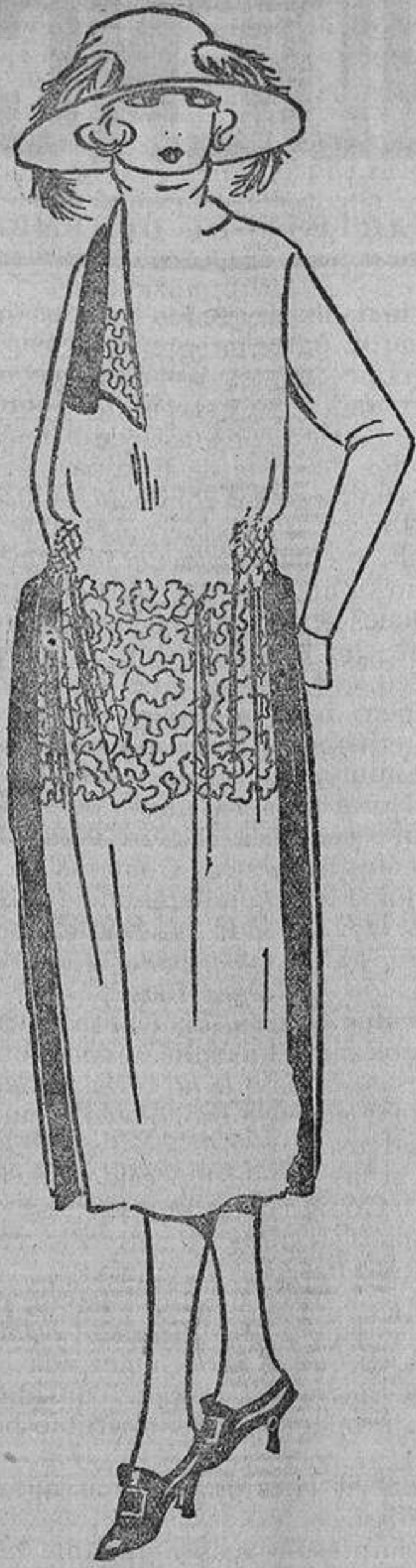
El vestido, de duvetina gris, tiene a los lados un frunce «nido de abeja»; las tiras de los lados y el forro del cuello, de seda azul «nattier». Culebrillas bordadas en plata y «nattier».