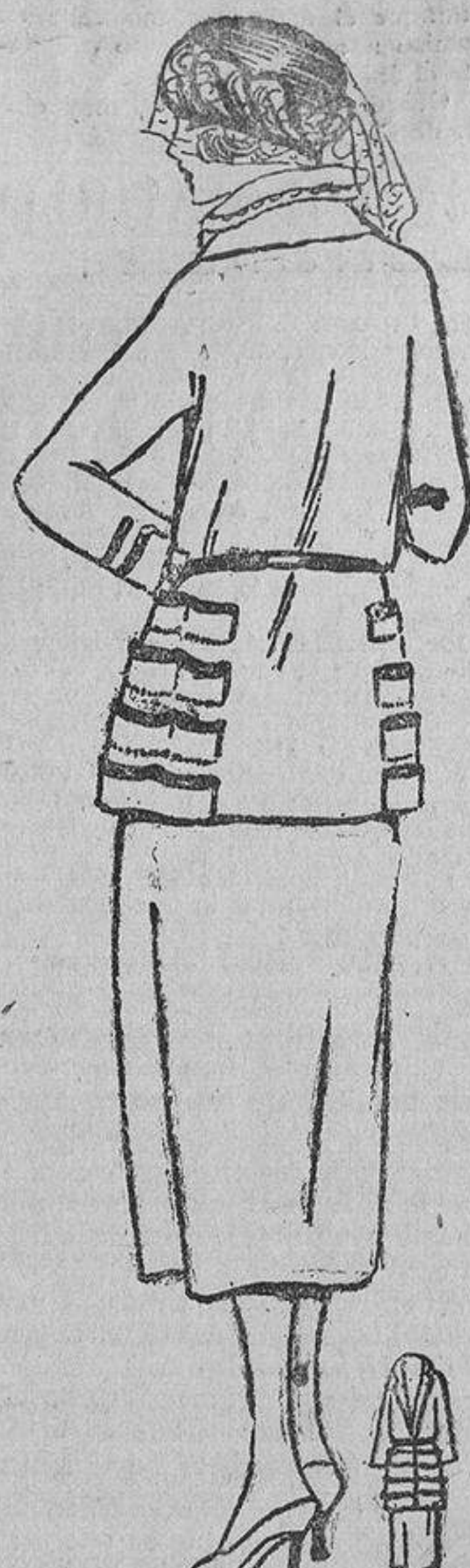
Para todo trote, un sencillo traje de lana color cuero, adornado con tiras de su tela, ribeteadas con cinta encerada.

CASA GUINARD NOVEDADES PARA VERANO SOMBREROS Y ADORNOS EXPOSICION: MONTERA, 31, ENTRESUELO