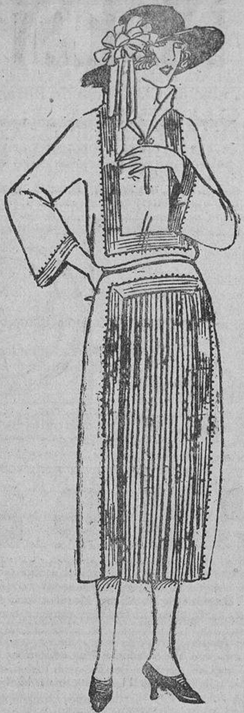
He aquí un bonito vestido, de sarga azul marino adornado con una ancha trencilla de seda negra unida con puntos de color; delantero plisado.

No calculamos demasiado; también hay vestidos estampados que nos hacen