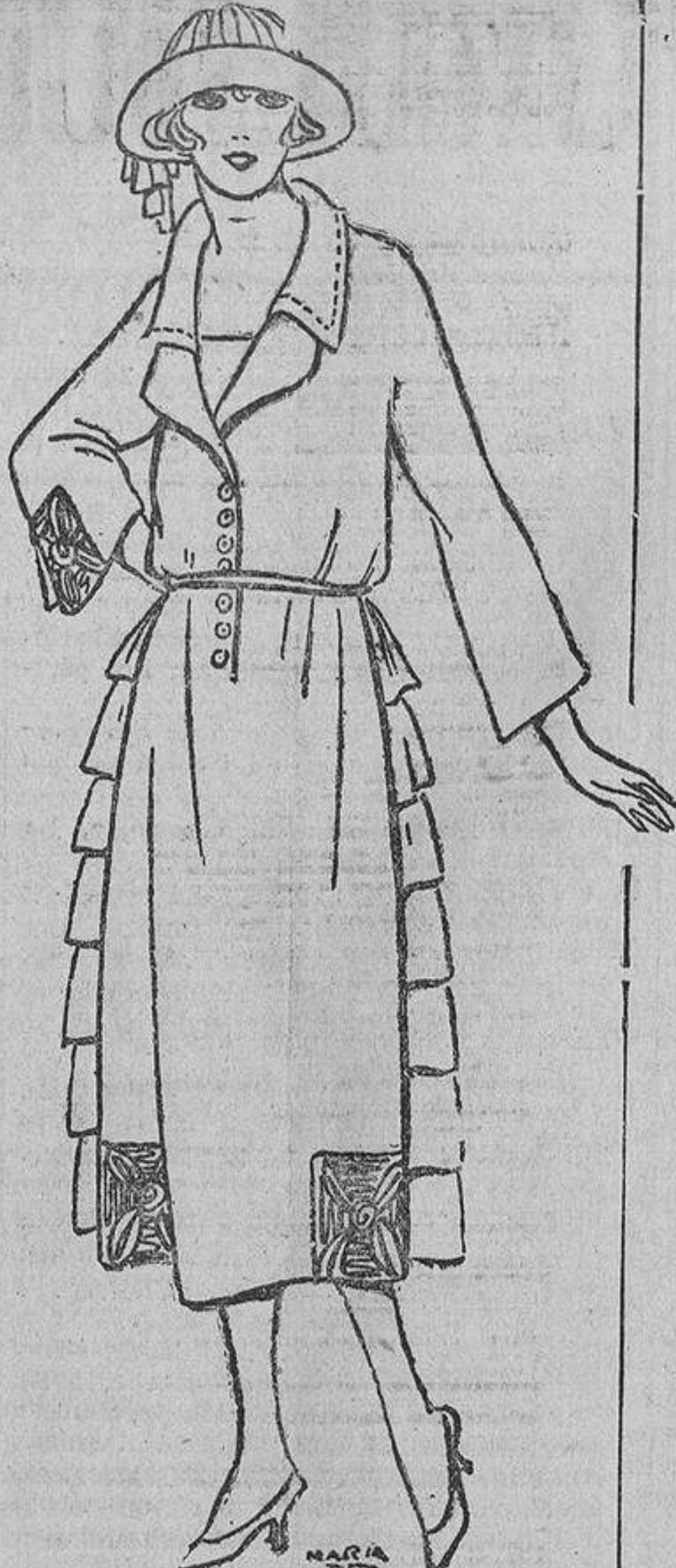
Este modelo admite muchas combinaciones; puede ser, por ejemplo, de terciopelo y tafetán o tafetán y crespón de China, con dos delanteros, uno detrás y otro delante, sueltos.