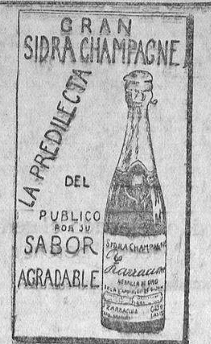
GRAN SIDRA CHAMPAGNE LA PREDILECTA DEL PUBLICO POR SU SABOR AGRADABLE

aqueilo el lugar más apropiado para las reuniones distinguidas.