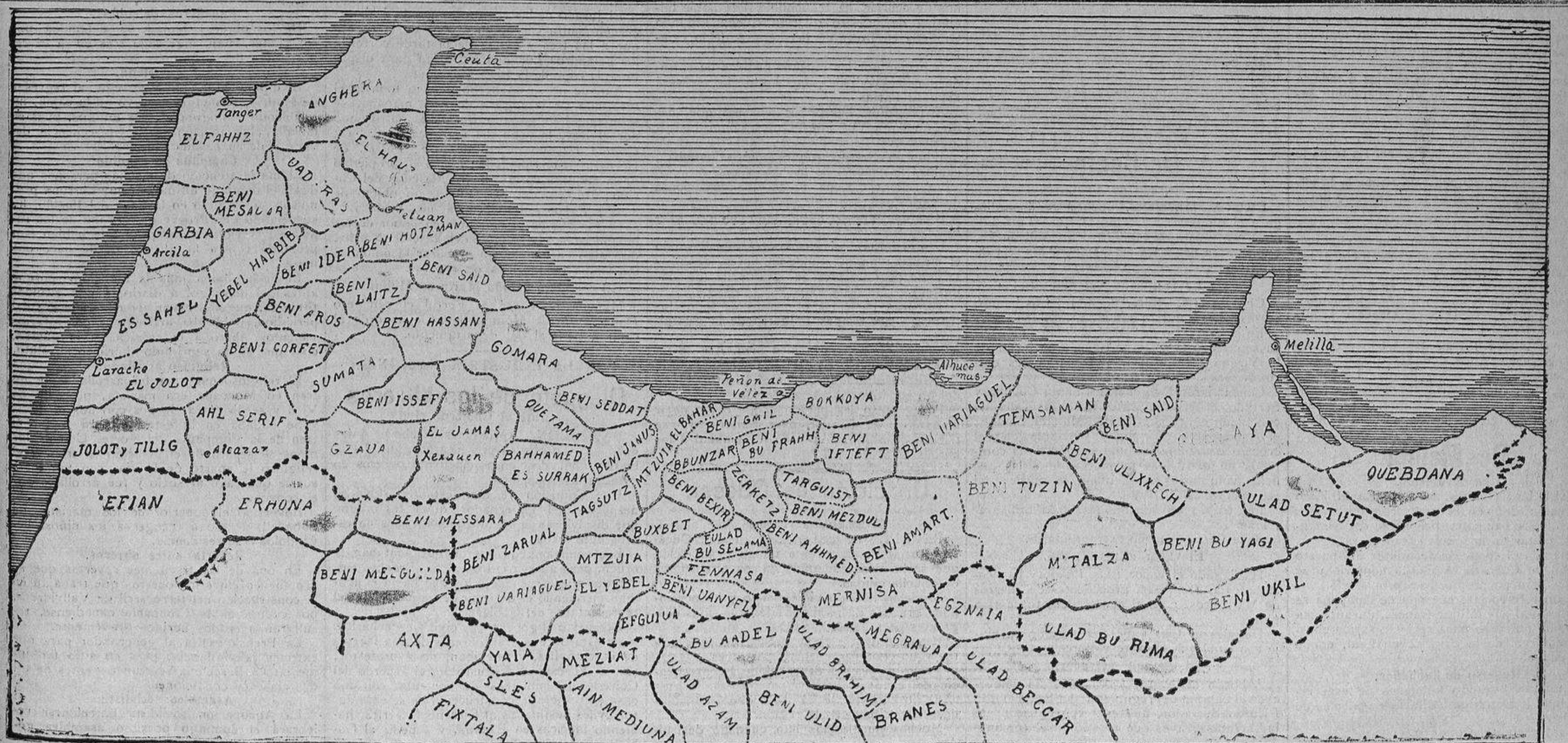
Nomenclator geográfico de las kabilas que forman la zona española, y de las fronterizas.

El retraso en realizar esta obra de tanto interés es utilizado como argumento para demostrar á los fanáticos la imposibilidad en que, dicen, se encuentra España de llevar á cabo el proyecto.