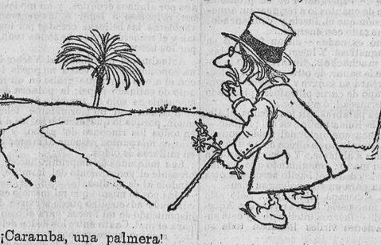
—¡Caramba, una palmera!