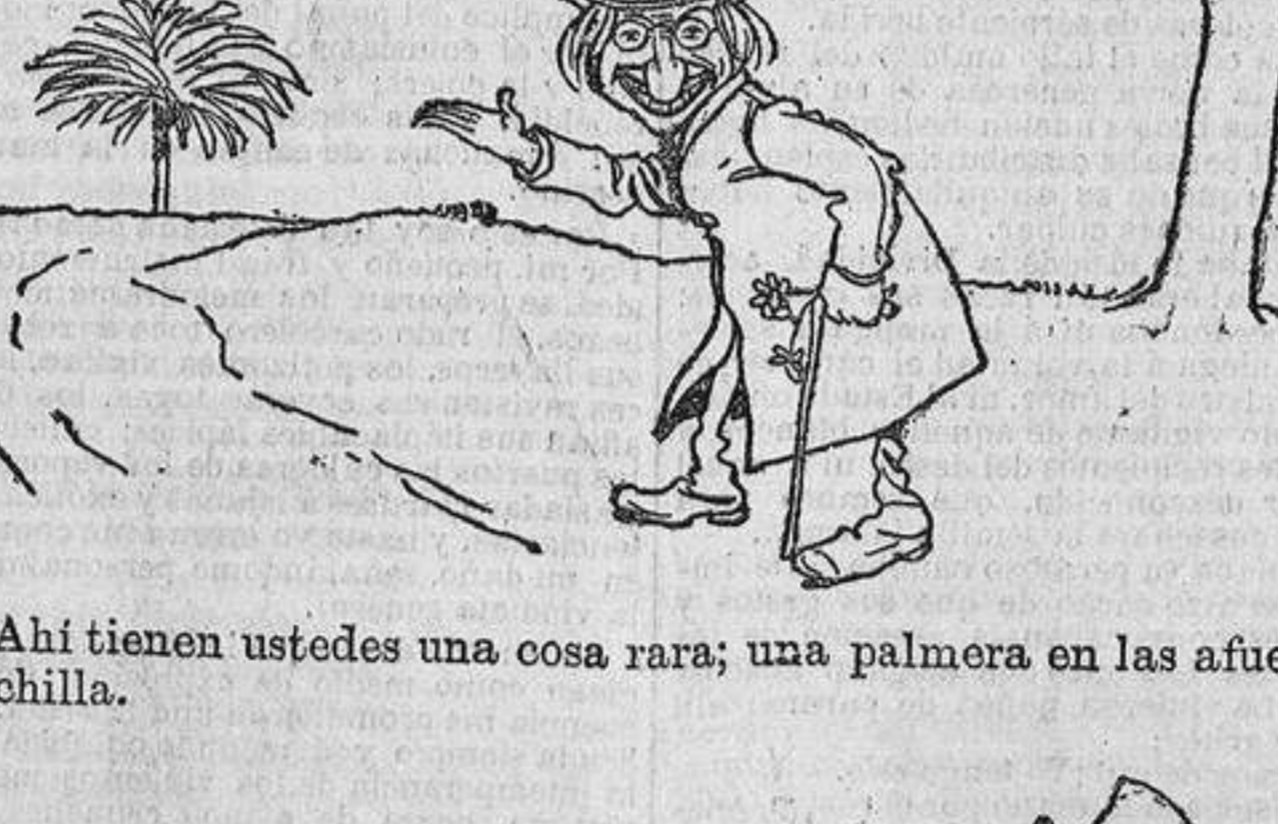
—¡Ahí tienen ustedes una cosa rara; una palmera en las afueras de Chinchilla.