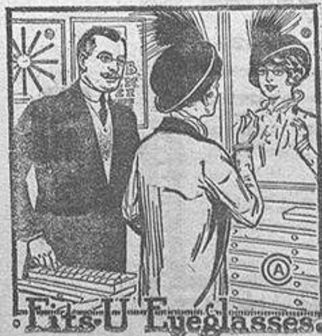
Fits U Eyeglasses

con maquinaria y aparatos para montar y entregar en el acto las recetas de los Sres. Oculistas,