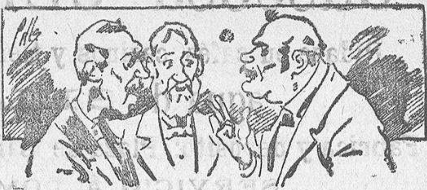
Abominan á nuestros libros..... pero los compran.

fórmulas para toda clase de ser beneficiosos. Cuenta además con buenos grabados, parte literaria excelente; da regalos mensuales á sus lectores con la Lotería Nacional y participaciones en la misma, á cuyo efecto compra todos los sorteos, y en una de las Administraciones más afortunadas por la suerte, billetes enteros. La suscripción y los números que se nos pidan se sirven gratuitamente á correo vuelto y franqueados, con sólo indicar el nombre y dirección del que lo desea en sobre dirigido al Sr. Administrador de