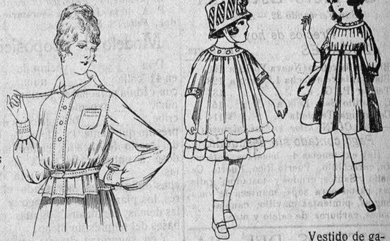
Blusa batista blanca, cuello con calados. A ptas. 4'50.

Camisería, Géneros de Punto, Corbatería, Guantería, Sombrerería, Zapatería, Bastones, Paraguas y Artículos de Viaje