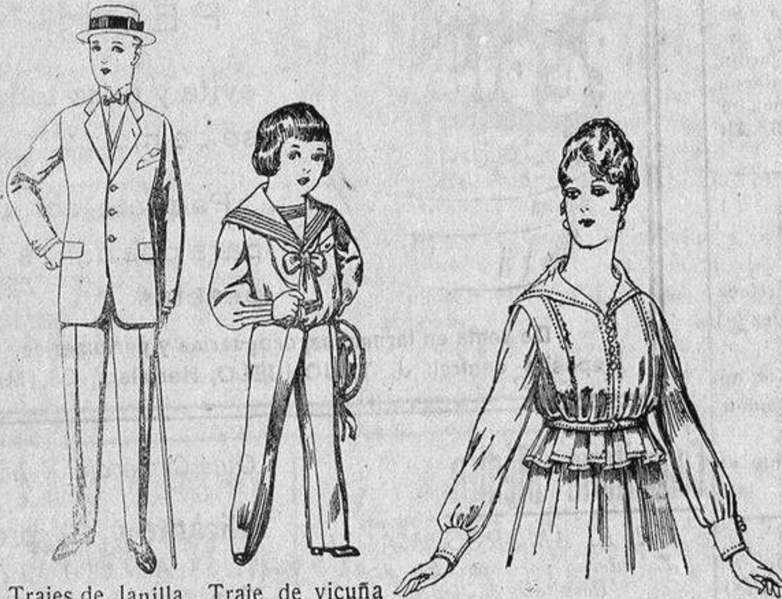
Trajes de lanilla, vicuña, etc., para jovencitos de 10 a 17 años. De ptas. 17 a 50.