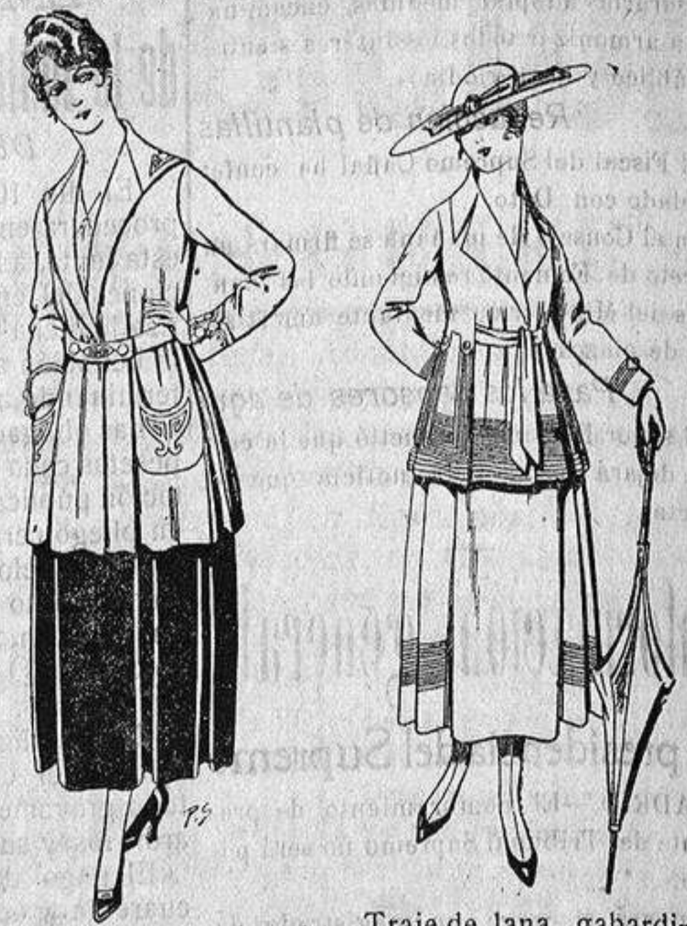
Paletot de tricot de seda o lana. De ptas. 14 a 57.