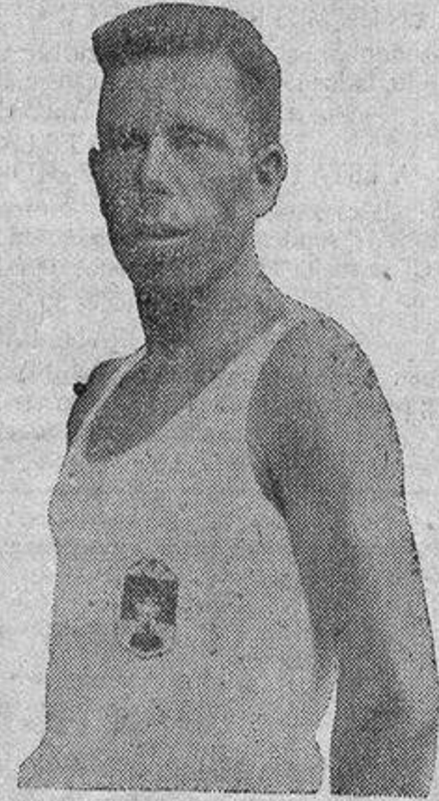
que mañana emprende el viaje a pié a Madrid

Si tienen razón o no en su practicismo, allá con sus teorías; nosotros caballeros de ideal y amparadores de todos los ideales románticos, queremos aunar a este joven que intrépido se lanza a una aventura sin provecho, solo por la admirable vanidad de destacarse de entre esta monotonía agobiadora de la vida.