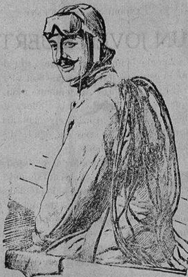
El famoso aviador francés PEGOUD que ha muerto víctima de un accidente de aeroplano en el frente de batalla.