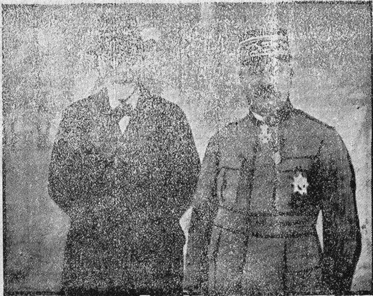
MR. VENIZELLOS Y EL GENERAL FRANCÉS GEROME