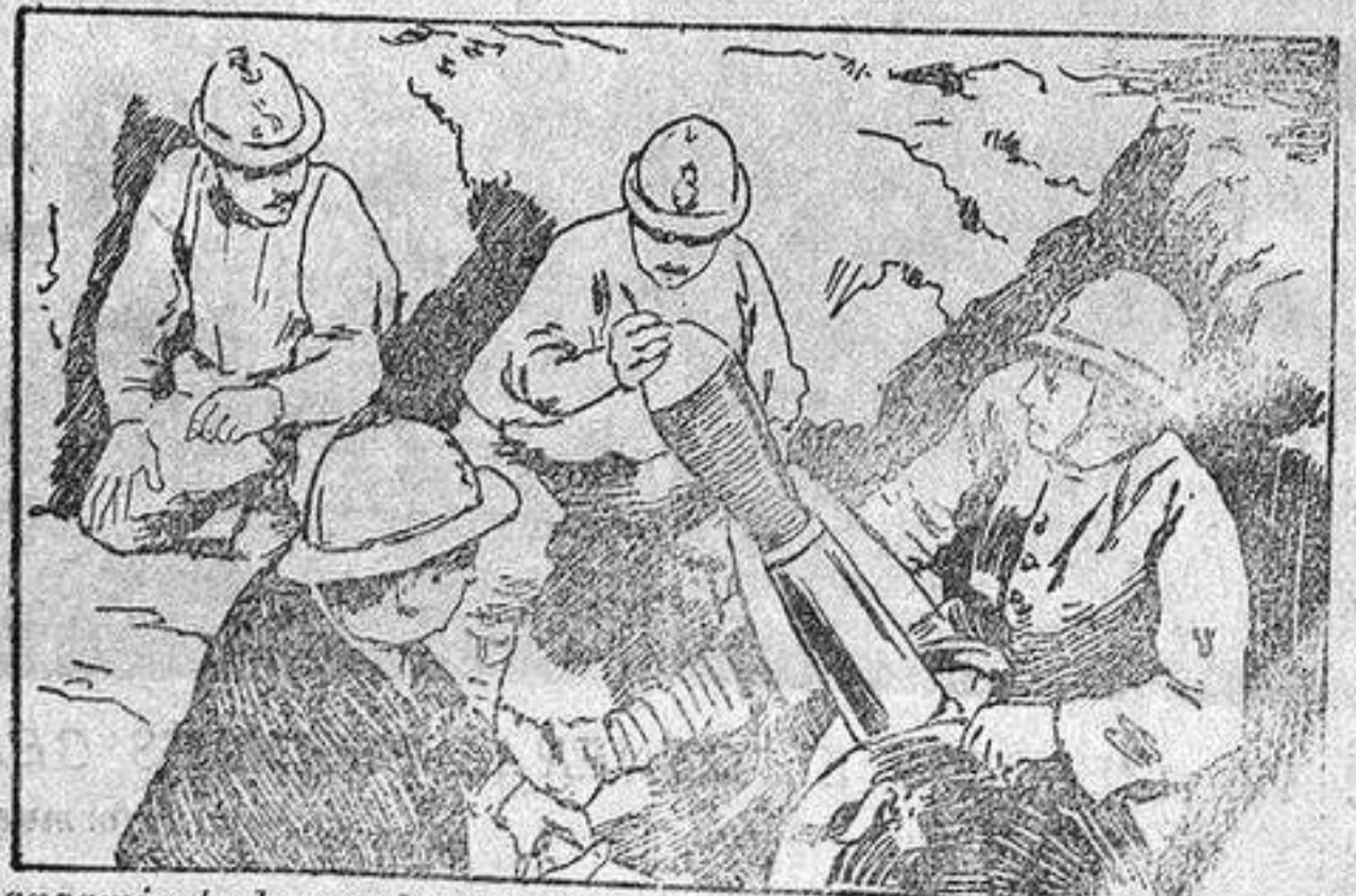
Lanzamiento de una bomba «torpilla» desde una trinchera