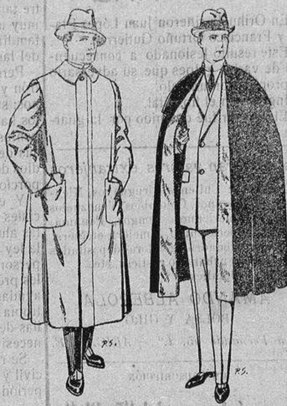
Impermeables forma gabán en color beige o gris De ptas. 35 a 100