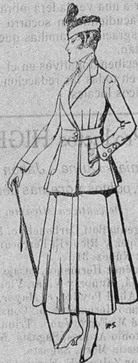
Trajes de lana negra azul y color, para señora De ptas. 50 a 55

Peletería, Camisería, Generos de Punto, Corbatería, Guantería, Sombrerería, Zapatería, Paraguas, Bastones y Artículos de Viaje.