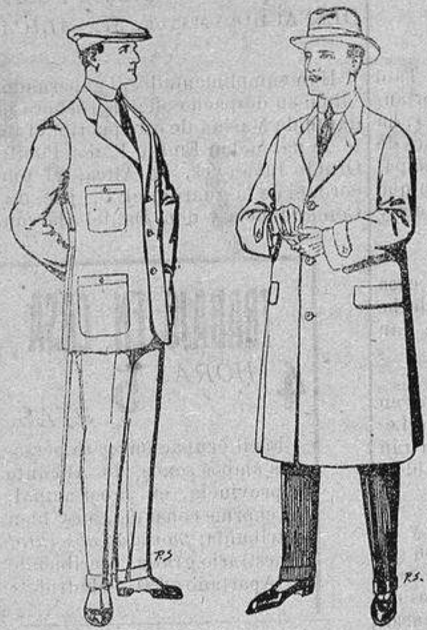
Trajes de cheviot corte elegante para "Sportman" De 35 a 50 ptas.

Madrid, Barcelona, Alicante, Almería, Bilbao, Cádiz, Cartagena, Gijón, Granada, Málaga, Palma de Mallorca, Santander, Sevilla, Valencia, Valladolid y Zaragoza