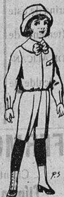
Trajes de patén para niños de 4 a 9 años De ptas. 5 a 7'50