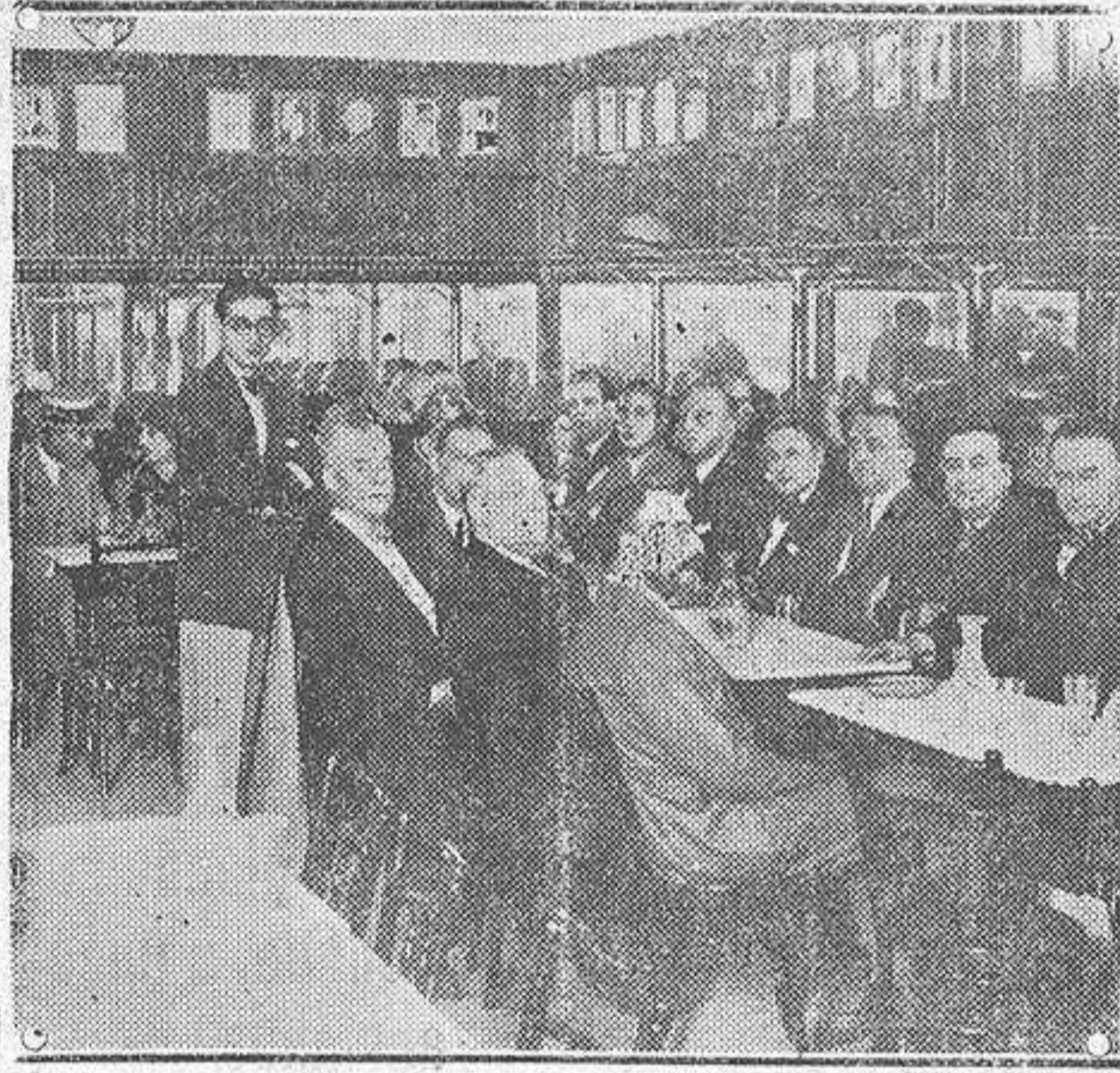
En el café «Castilla» de Madrid ha expuesto el conocido dibujante Sirio, una colección de caricaturas y acto invitó a las personas caricaturizadas