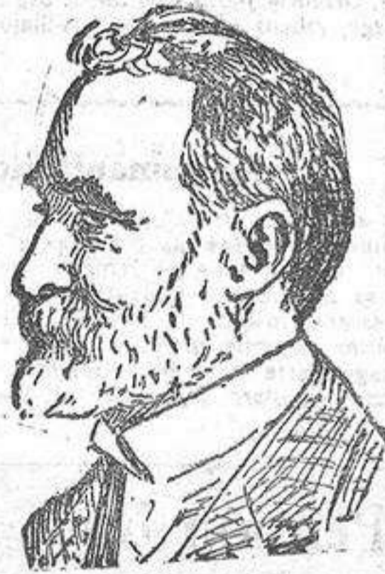
El señor Marqués de Valdecilla, distinguido filántropo santanderino, que ha regalado 14 millones para un hospital a la capital montañesa.