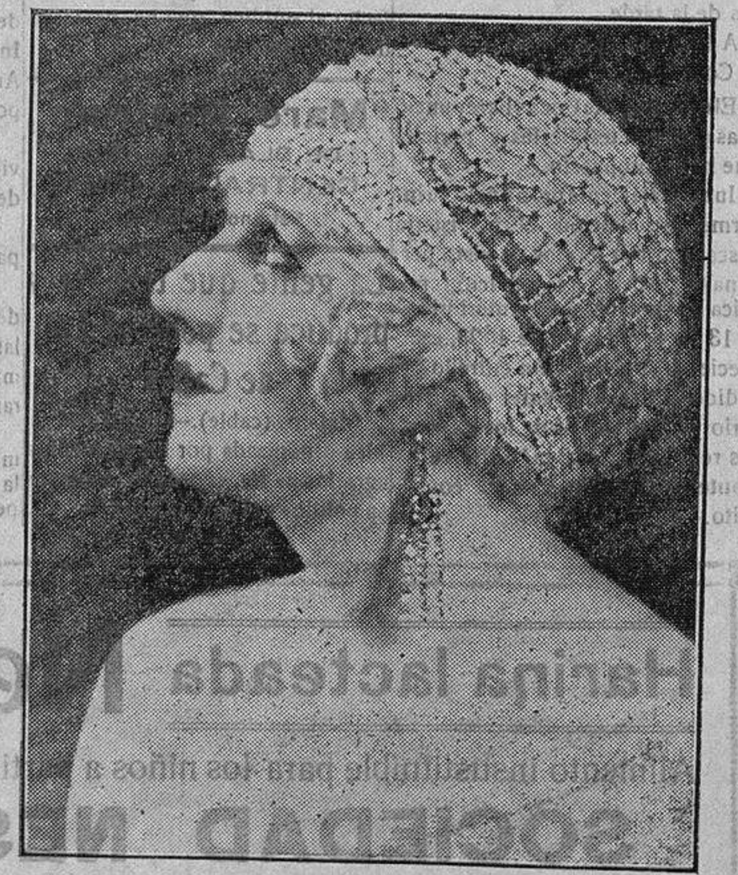
HUGUETTE DUFLOS, estrella cinematográfica francesa, protagonista de la superproducción "LA PRINCESA QUE SUPO AMAR", presentada por la Federación Cinematográfica Latina, película que está obteniendo estos días un éxito resonante en Barcelona y que el próximo miércoles día 19, se estrenará en el CENTRAL CINEMA