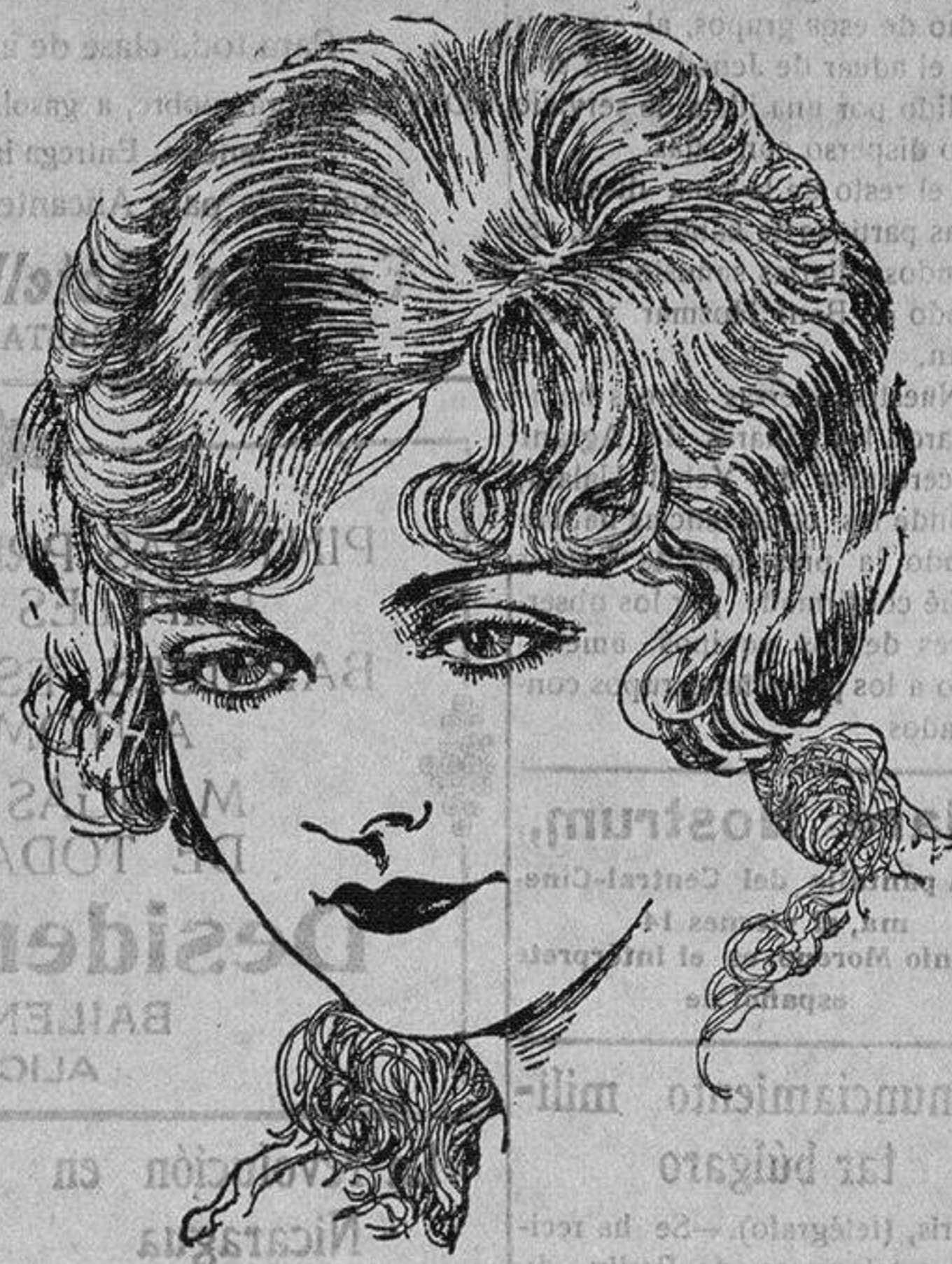
Alice Terry, la eminente artista que interpreta el papel de "Freya", la espía alemana, en "MARE NOSTRUM"

Ulyses, seducido por la belleza de la espía alemana, se hace a la mar y acaba por verse obligado a llenar de gasolina los tanques de un submarino alemán. Al regresar de este viaje anónimo se entera de que Italia va a la guerra y de que Freya y sus compañeros han desaparecido. Le dicen también que su hijo estuvo a buscarle y que regresó a Barcelona. Temiendo por la vida de su hijo, dado que nadie mejor que él sabía la inseguridad de un viaje por mar en esos momentos, sale para Marsella. Esa misma noche Ulyses visitó la cabina del radiotelegrafista. A los pocos momentos el radio funcionó y llegó un mensaje pidiendo auxilio. El barco en que su hijo viajaba había sido atacado y echado a pique por un submarino. Lo co de desesperación por la pérdida de su hijo, de la que se reconoce culpable, Ulyses llega a Marsella, donde encuentra a Freya, quien temiendo por su vida le ruega que la salve, pues los franceses, advertidos de la presencia de la espía, no tardarán en prenderla. Ulyses está dispuesto a ello, pero la visión de su hijo muerto, se lo impide. Freya es arrestada y fusilada por los franceses. Ulyses puso su barco a la disposición del gobierno francés y en su primer viaje fue sorprendido por un submarino. Se libra la batalla y todos fueron al fondo del mar. Ulyses salió de las olas y exclamó: «Freya-Amphitrita! Y sintió como si la diosa lo acogiera en su seno y lo llevara al fondo del mar, como había llevado a todos los Ferraguts.