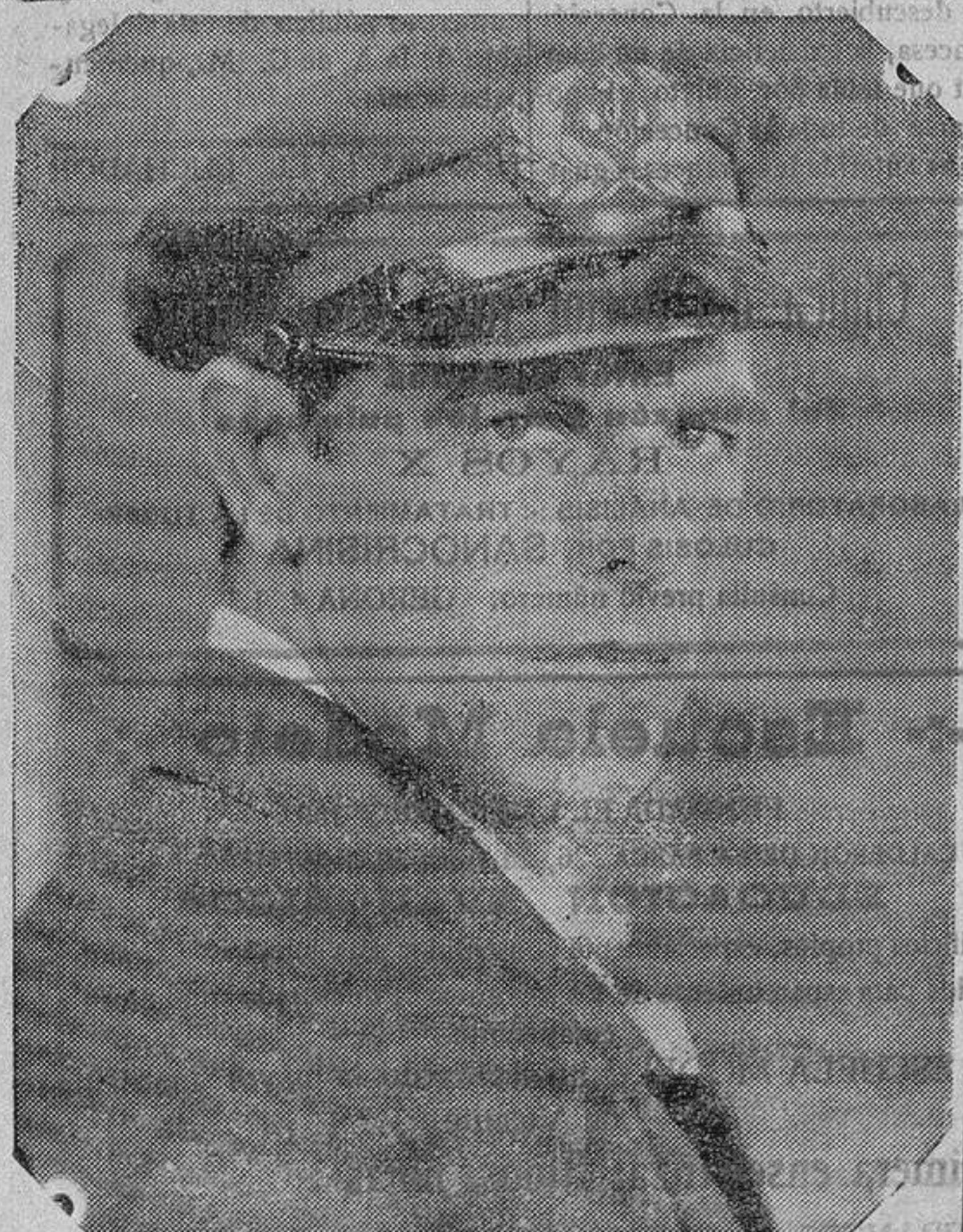
ANTONIO MORENO, interprete de "MARE NOSTRUM", artista español, as de la pantalla