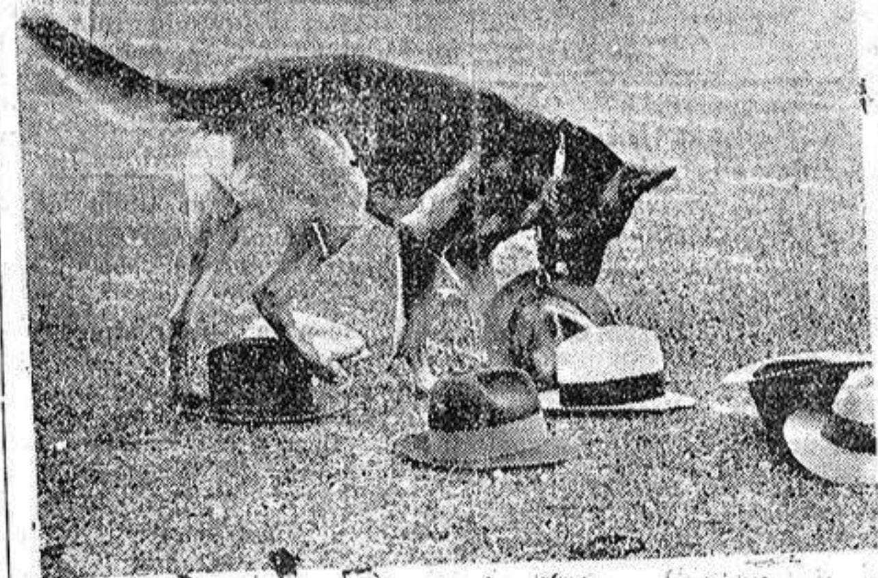
Concursos de perros policíacos.—Un perro efectuando una prueba que consiste en buscar entre otros el sombrero de su amo y llevárselo.