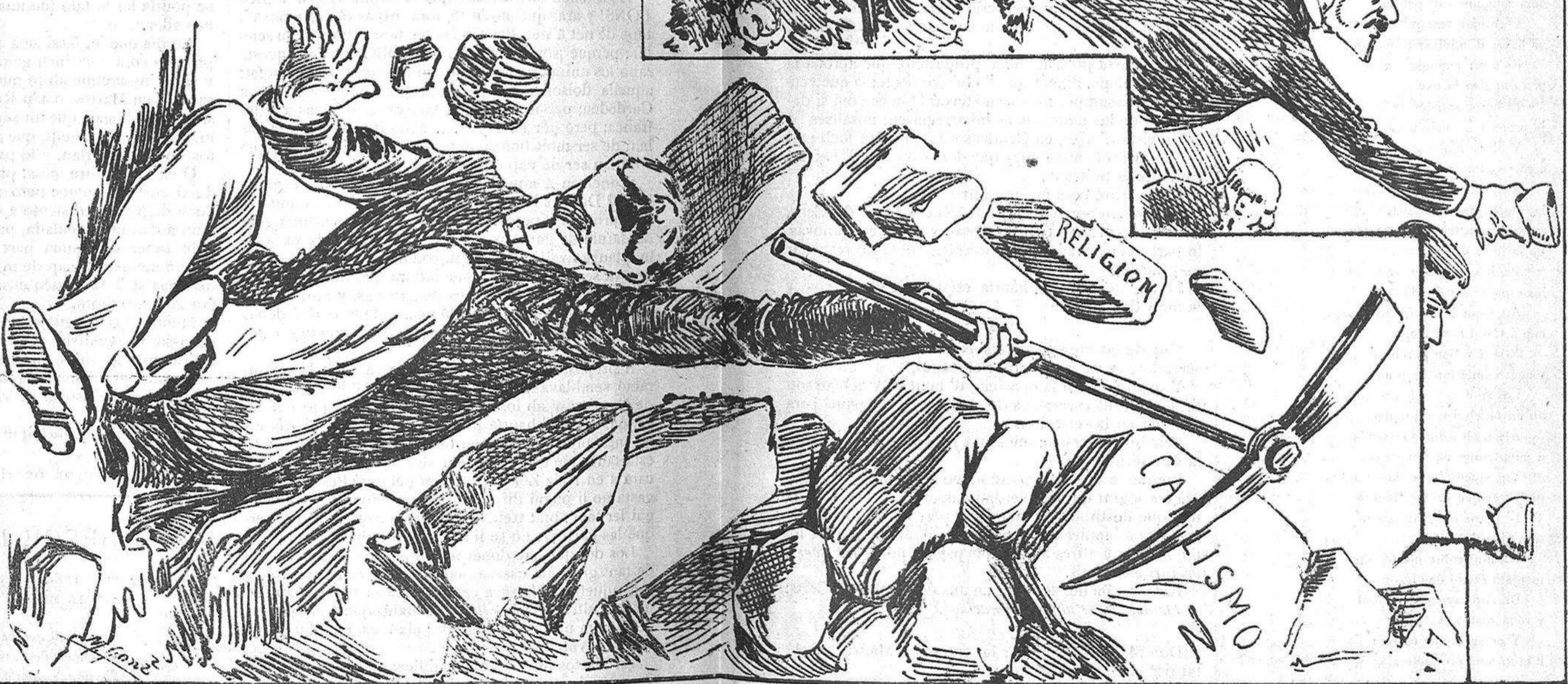
Vaja aquest edifici no 'i podern tocar que no 'ns aplasti...