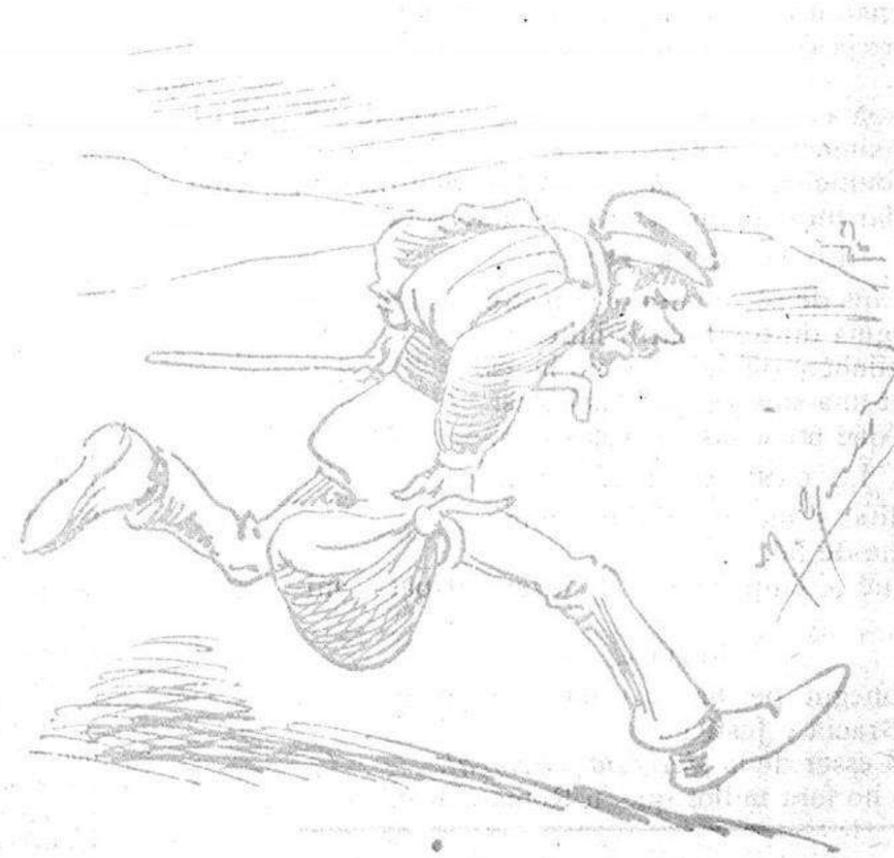
Ja no paro hasta la Manxa ¡lo alabarlos!... ¡Quina planxa!!