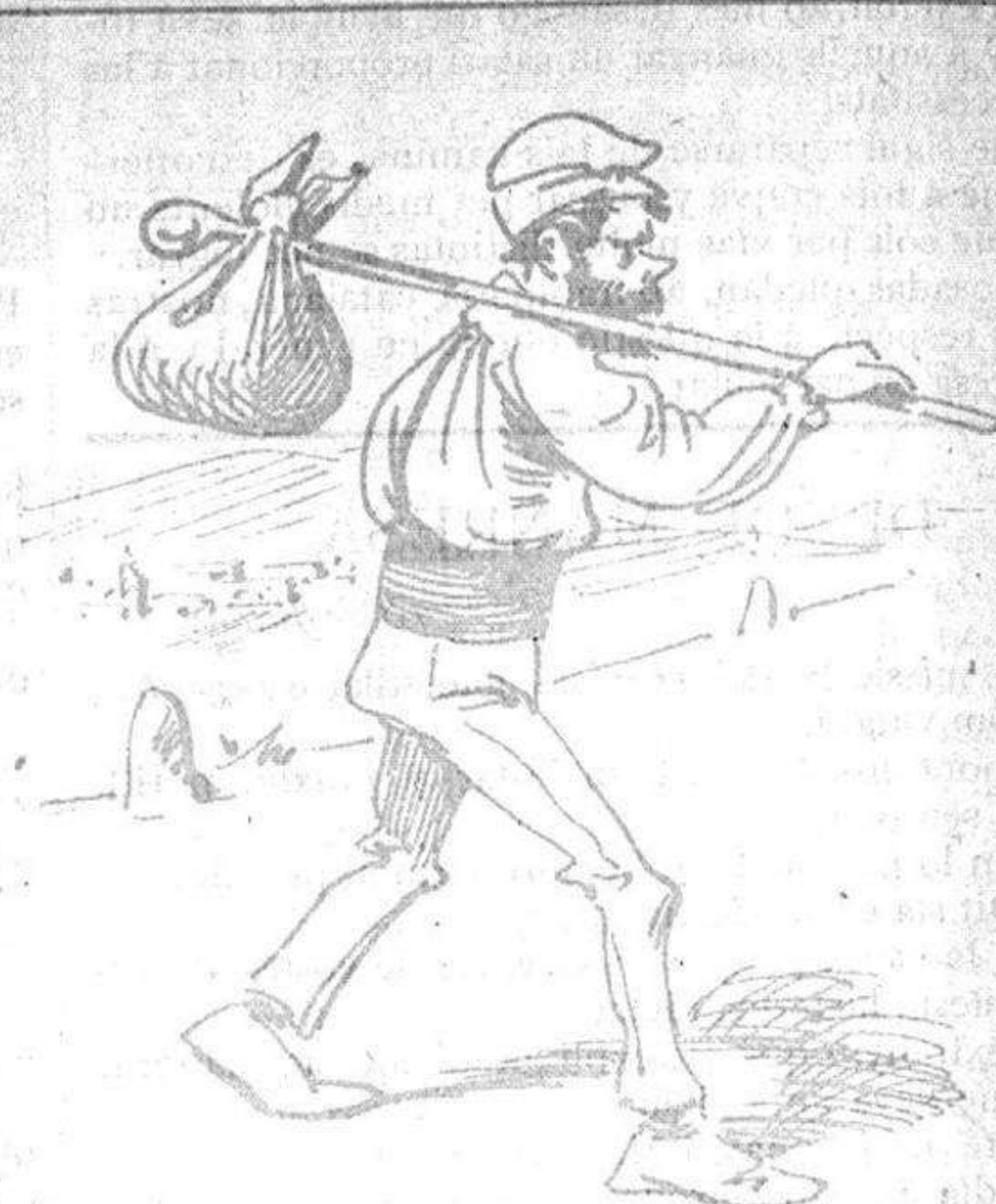
No es lliberal ni ho abona qui en aquets moments no deixa sense exhalar una queixa, sogres, pares, fills y dona.