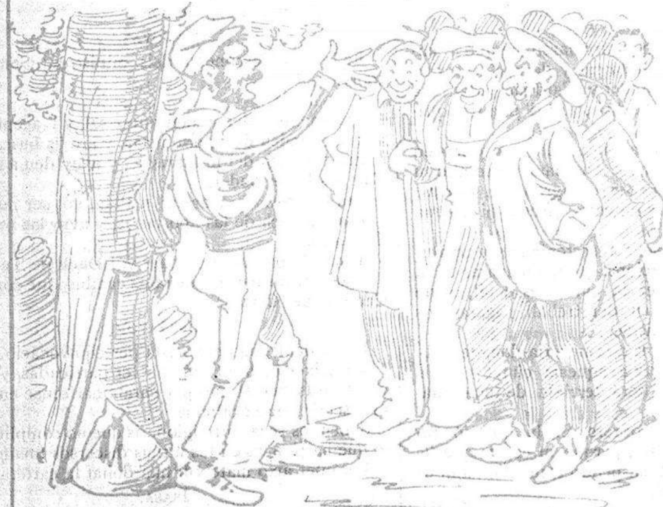
—Varen fer quintars de proesas per la causa la mes noble; dignas en tot d' aquest poble de gegants y... gegantesas!!