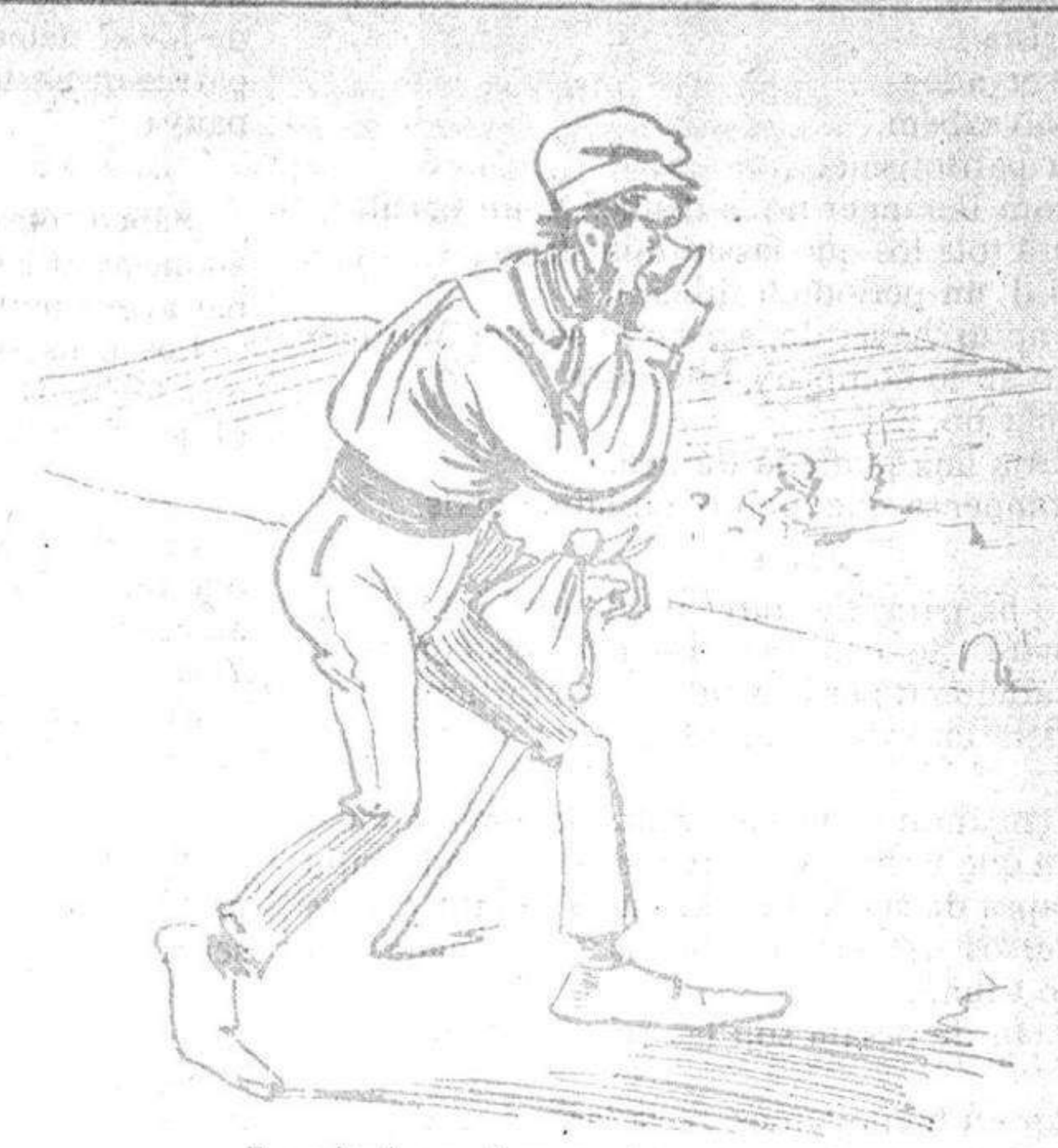
Rumiare un discurs, de pas, necrológich laudatori, qu' estich cert que l' auditori quedarà ab un pam de nás.