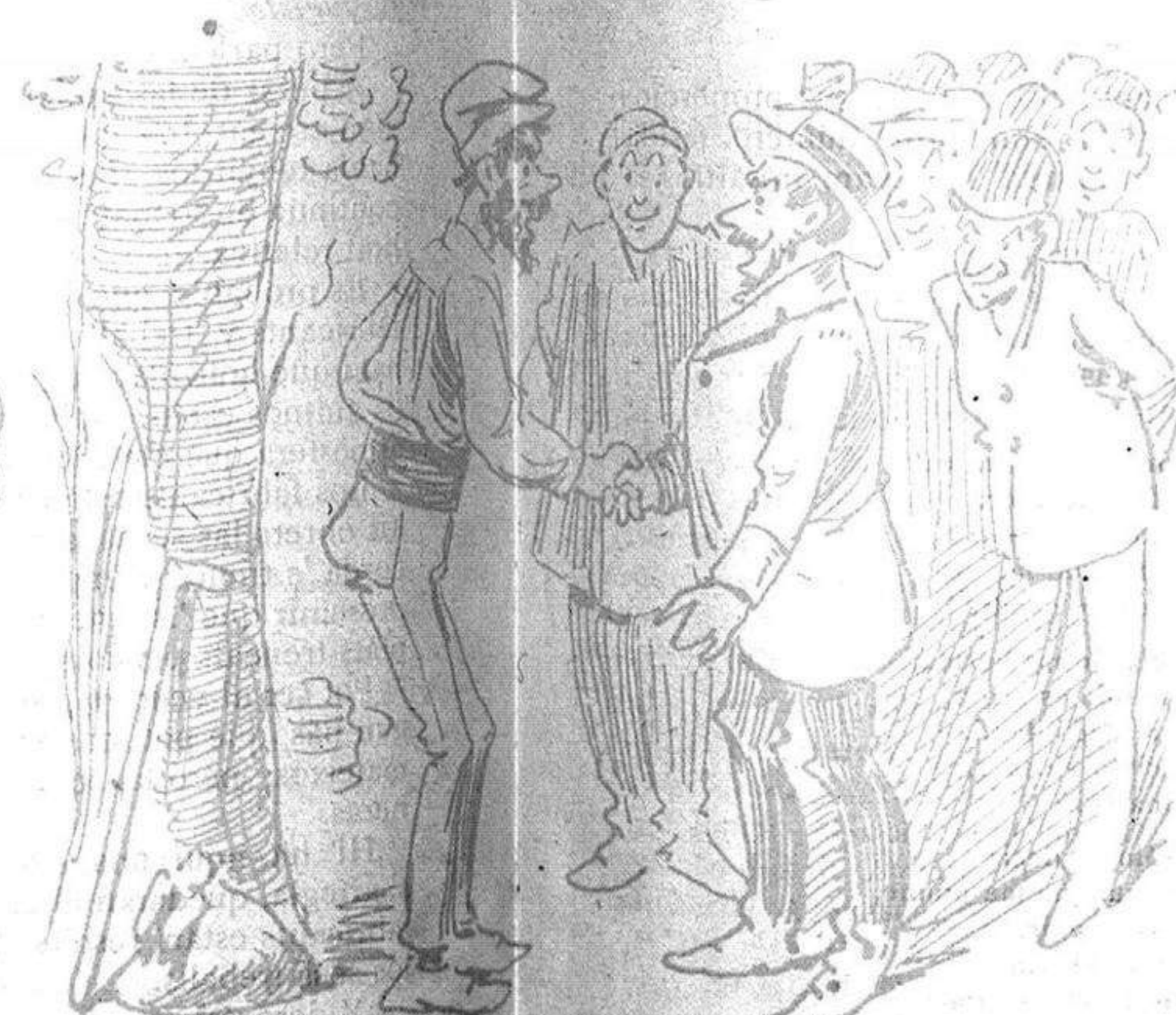
—Per 'ls carlins qu' aqui jeuhen os dem las gracias. —Qué diéu? —son carlistas? —Y á cap préu os pagarem lo que os deuen.