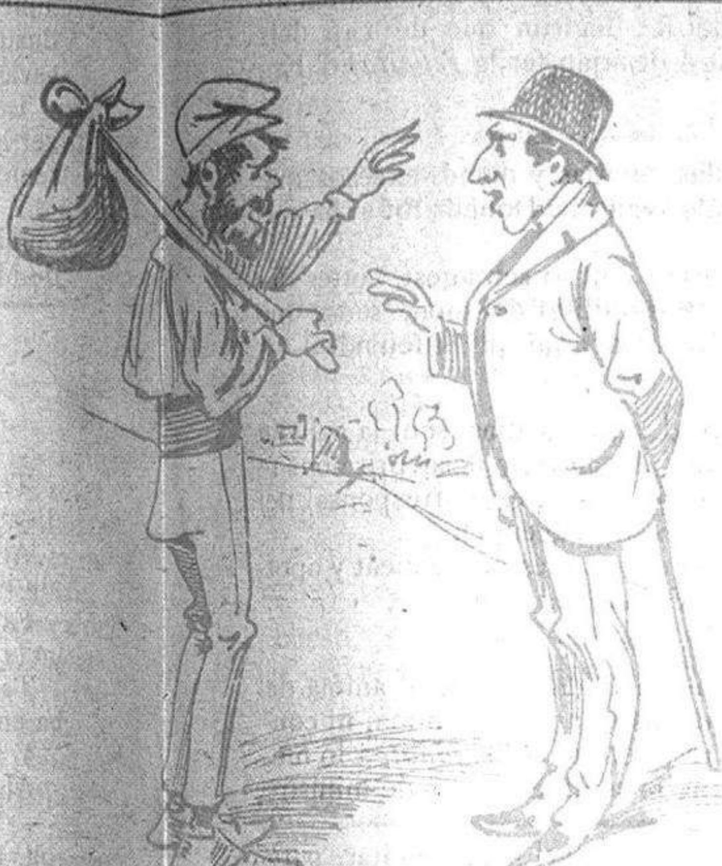
—Los héroes inmoltats per 'ls carlins, hont son sabéu? —L' arbre mes gros que veureu los té en son peu enterrats.