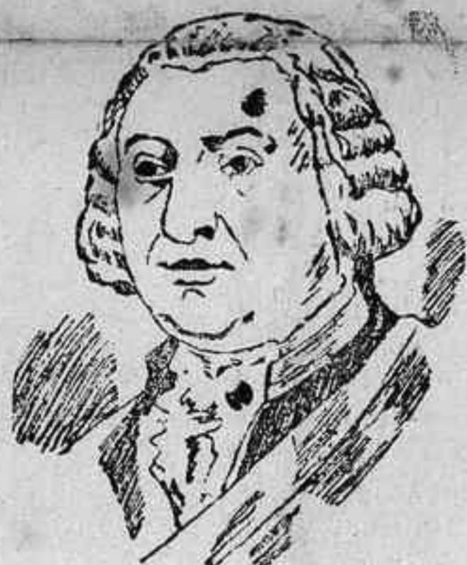
Había nacido en Madrid el 23 de

Fernando VI, segundo hijo del monarca español Felipe V, ha sido calificado como uno de los reyes más pacíficos y beneficiosos que han existido, y como uno de los que más han descollado por su amor á las artes, á las ciencias y á la industria.