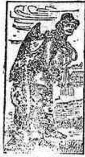
Marka de fabrica.

Deben tomar una medicina alimento que les permita recobrar con rapidéz las carnes, las fuerzas y la salud perdidas. Esta medicina-alimento es la famosa Emulsión de Scott compuesta de aceite de hígado de bacalao emulsionado, hecho fácil de tomar y de digerir, y combinado y notablemente enriquecido con la adición de los hipofosfitos de cal y de sosa. Bien conocidas son las propiedades de estos últimos como tónicos para el cerebro, los nervios y los huesos. Las personas que estén convaleciendo de cualquier enfermedad ó que por cualquier motivo se encuentren débiles ó perdiendo carnes, notarán gran mejoría tan pronto empiecen a usar el gran tónico y nutritivo, favorito de los medicos, la