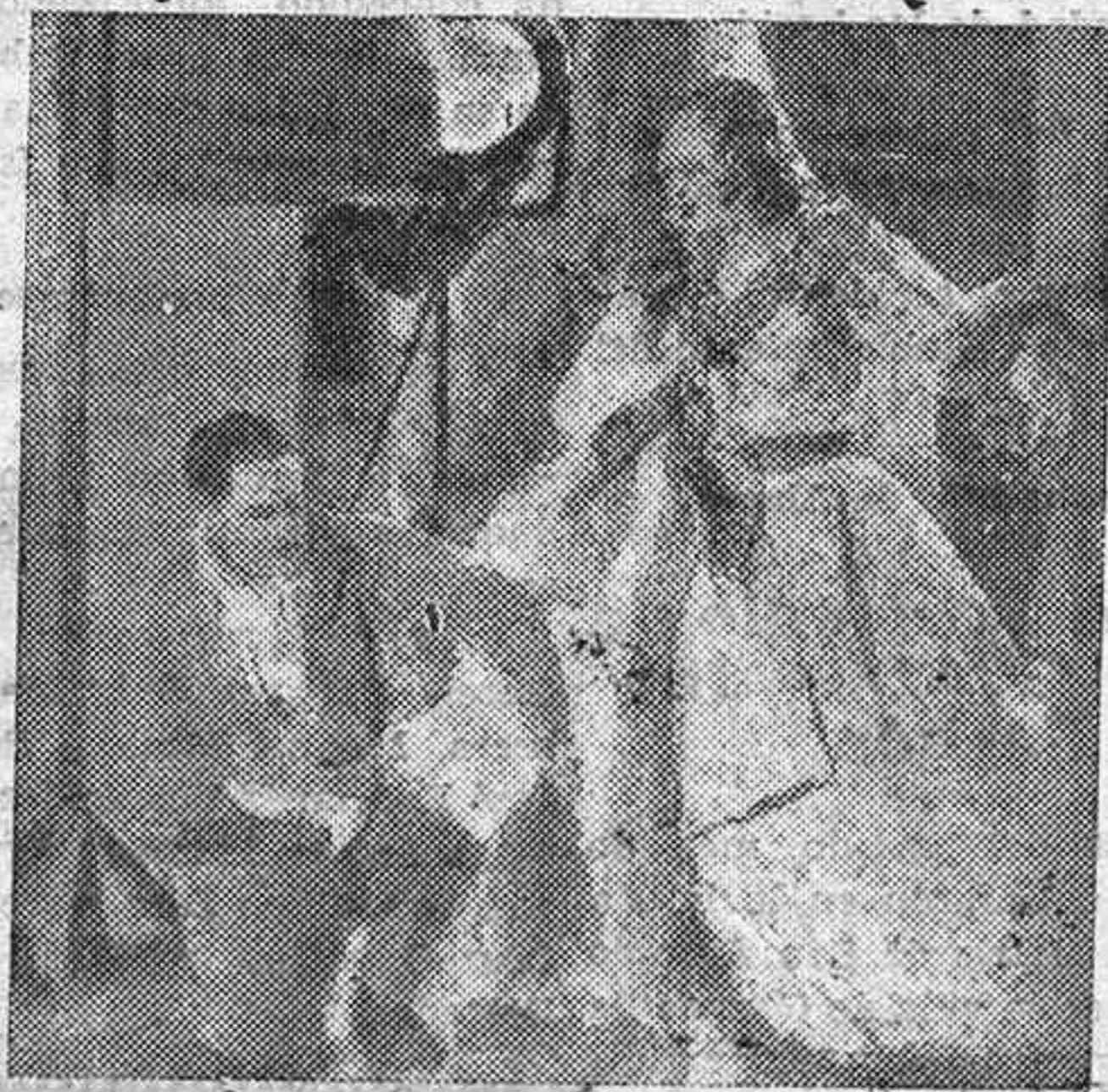
EL DETALLE INTERESANTE

Como todo lo que a Tenerife conviene no podemos esperar del Estado—ya que, por desgracia, el Estado se muestra siempre reafectado en atender nuestras aspiraciones y en resolver nuestros problemas—, al Cabildo le corresponde el deber de ser quien acometa la magna obra del funicular al Teide, porque esta obra es de trascendentalísimo beneficio para toda la isla, desde esta capital al conjunto de nuestros pueblos.