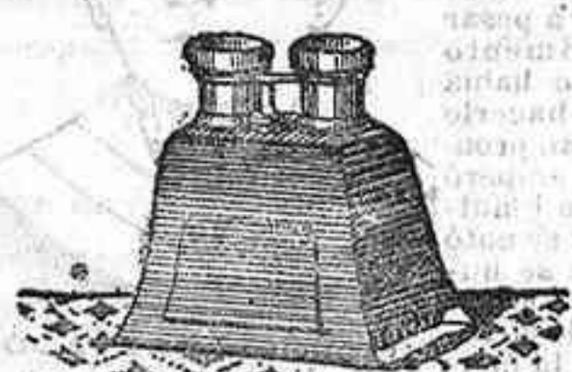
Stereoscopio y doce vistas exp. posición de 1900, 12'50 PTS.

PLACAS Y PAPELES DE LUMIERE, GUILLÉNINOT, ST. CLAIR, LIESEGANG, AMERICANAS Y ALEMANAS