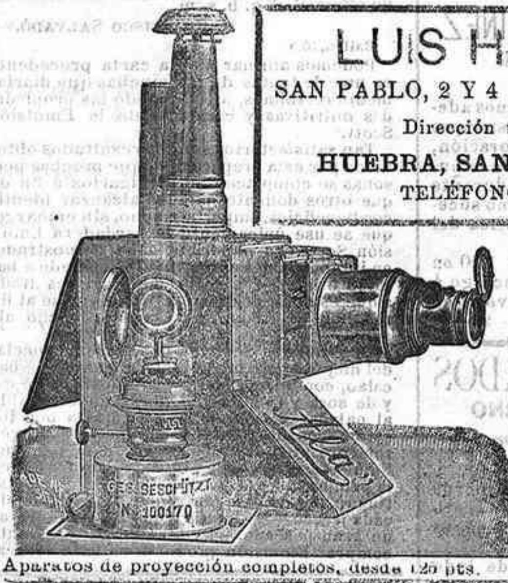
Aparatos de proyección completos, desde 120 pts.

LUIS HUEBRA SAN PABLO, 2 Y 4 SALAMANCA Dirección telegráfica: HUEBRA, SAN PABLO, 2 Y 4 TELÉFONOS, 88 Y 41