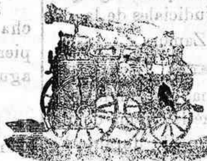
Máquina de vapor locomovil.

Maquinas de vapor —Bombas.—Pesas.—Tubos de todas clases.—Aparatos para hacer gaseosas y toda clase de ma. uinas.