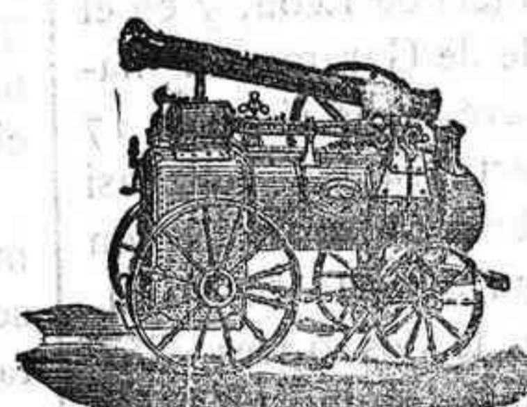
Máquina de vapor locomovil