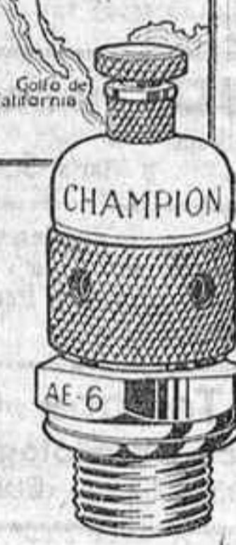
Bujía especial para Aviación.