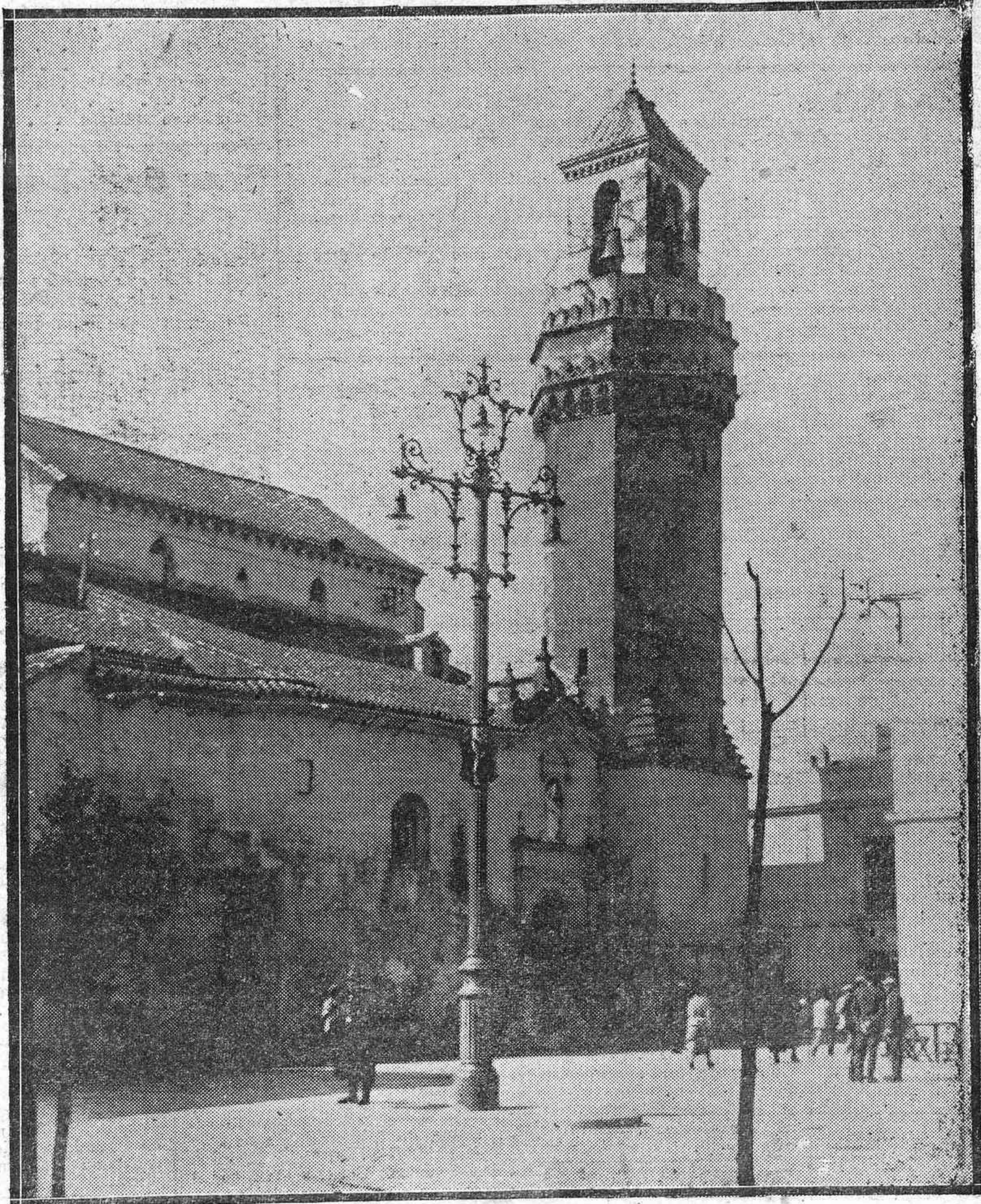
Bellísima torre poligonal de San Nicolás. En los omoplatos de la ancha Avenida, yergue esta torre la elegante verticalidad de sus aristas, agudas y cortantes como hoja damasquina. Y arriba laten las campanas—corazones de bronce—en una mística llamada a la oración.