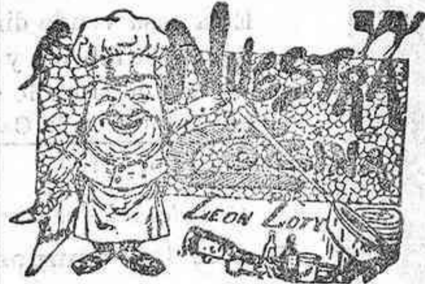
Comidas para el 25 de Septiembre

Con licencia del M. I. Sr. Gobernador eclesiástico de esta diócesis, S. P., estará expuesto S. D. M. en forma de jubileo, todos los días de la novena, costeado por varios devotos.