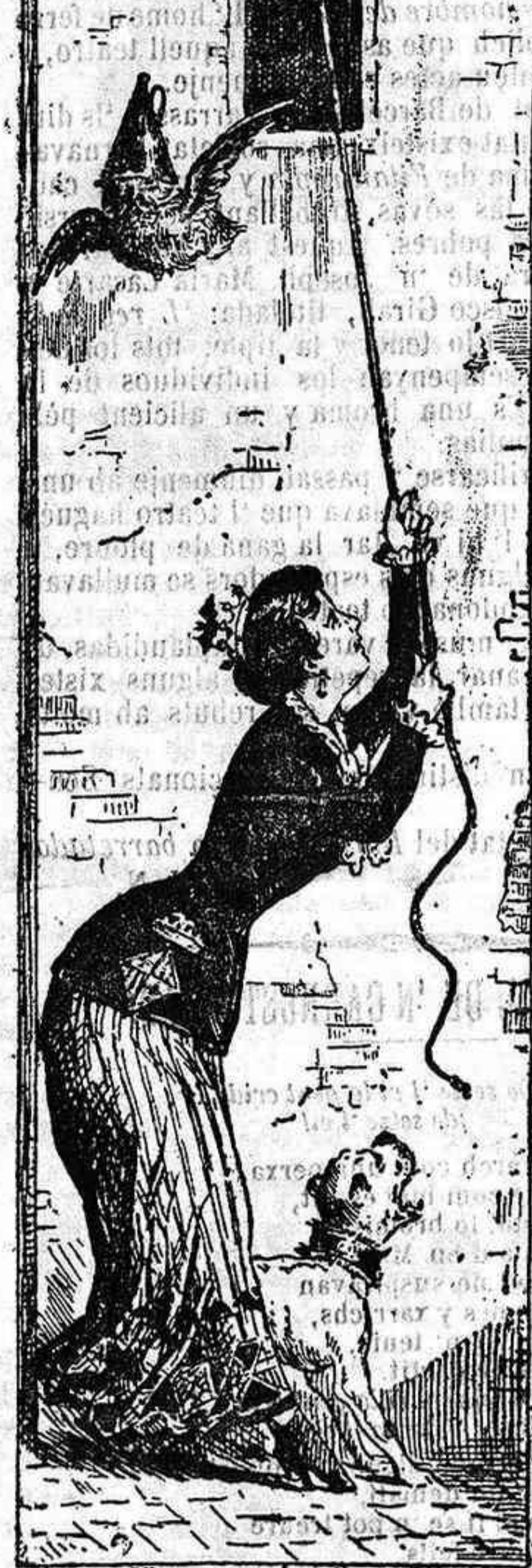
UN VOT DE PÉS.